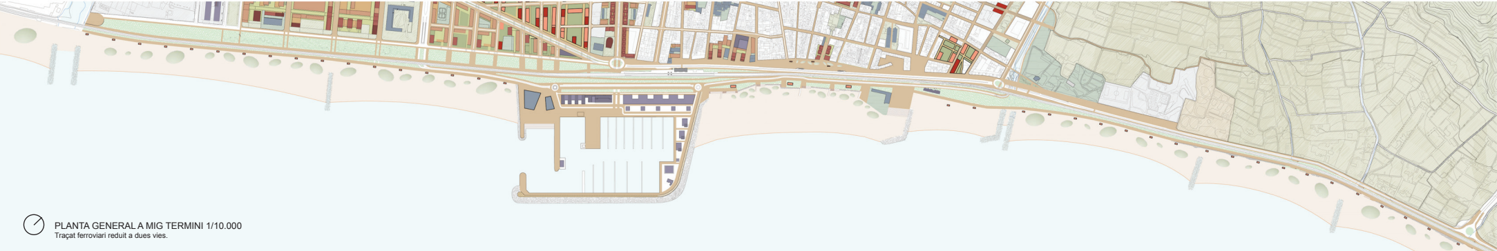
PLANTA GENERAL A MIG TERMINI 1/10.000 Traçat ferroviari reduït a dues vies.

Mataró és una ciutat molt densa, sobretot el centre, que presenta pocs espais verds i carrers arbrats. Tot i que a mida que ens desplaçem cap al nord apareixen grans parcs i avingudes arbrades, cal que el verd entri més a la ciutat, i hi ha carrers, espais públics i espais en desús amb potencialitat per fer-ho.