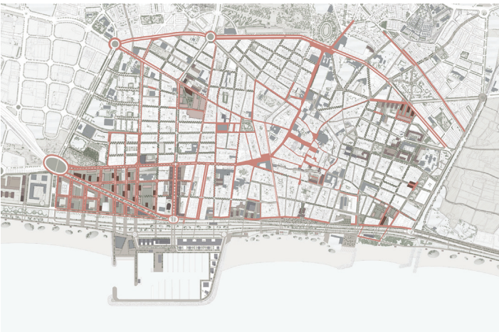
EIXOS COMERCIALS DEL CENTRE