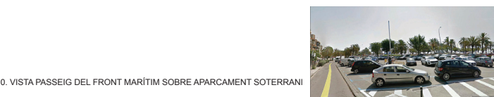
00. VISTA PASSEIG DEL FRONT MARÍTIM SOBRE APARCAMENT SOTERRANI