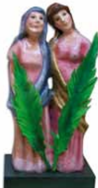
Figura de Les Santes