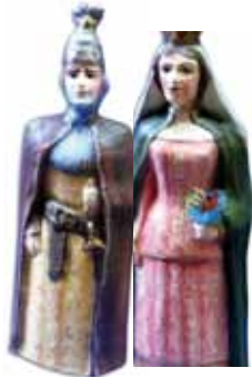
Figura del Robafaves / la Geganta/ Toneta/ Maneló

Fetes a mà i realitzades en paper maixé.