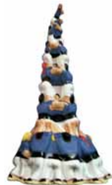
Figura del castell dels Capgrossos

Reproducció feta a mà i en paper maixé d'un castell de la colla castellera Capgrossos de Mataró.