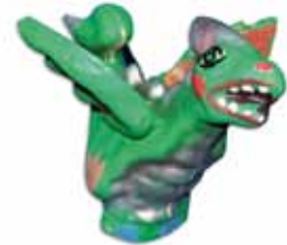
Figura del Dragalió petit

Fetes a mà i realitzades en paper maixé. Artesà: Sergio Laniado