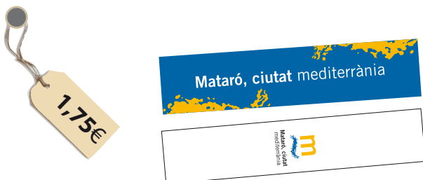
Punt de llibre Mataró, ciutat mediterrània Reprodueix la marca Mataró, ciutat mediterrània. Realitzat en paper. Mides: 20 x 4 cm