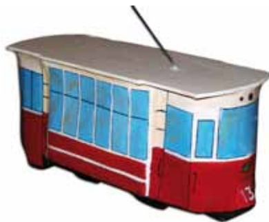
Figura del tramvia

Reproducció feta a mà i en paper maixé del tramvia de Mataró.