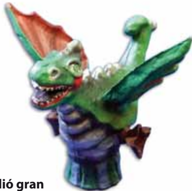
Figura del Dragalió gran

Fetes a mà i realitzades en paper maixé. Artesà: Sergio Laniado