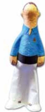
Figura del casteller/a

Fetes a mà i realitzades en paper maixé.