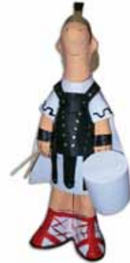
Figura de l'Armat

Reproducció feta a mà i en paper maixé dels Armats de Mataró.