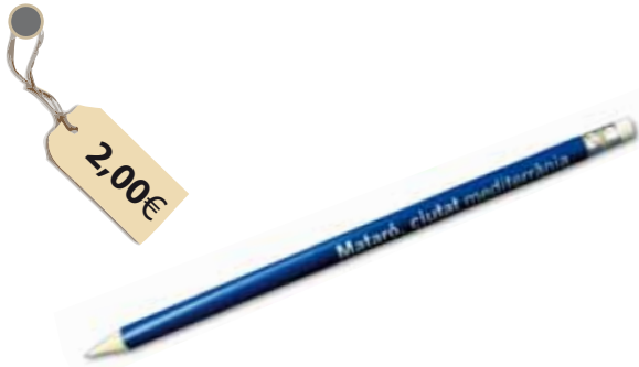
Llapis Mataró, ciutat mediterrània Reprodueix la marca Mataró, ciutat mediterrània.