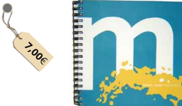
Llibreta Mataró, ciutat mediterrània La portada reproduïx la marca Mataró, ciutat mediterrània. Mides: 15 x 15 cm