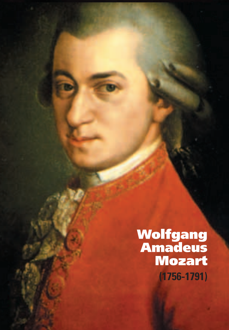
Wolfgang Amadeus Mozart (1756-1791)