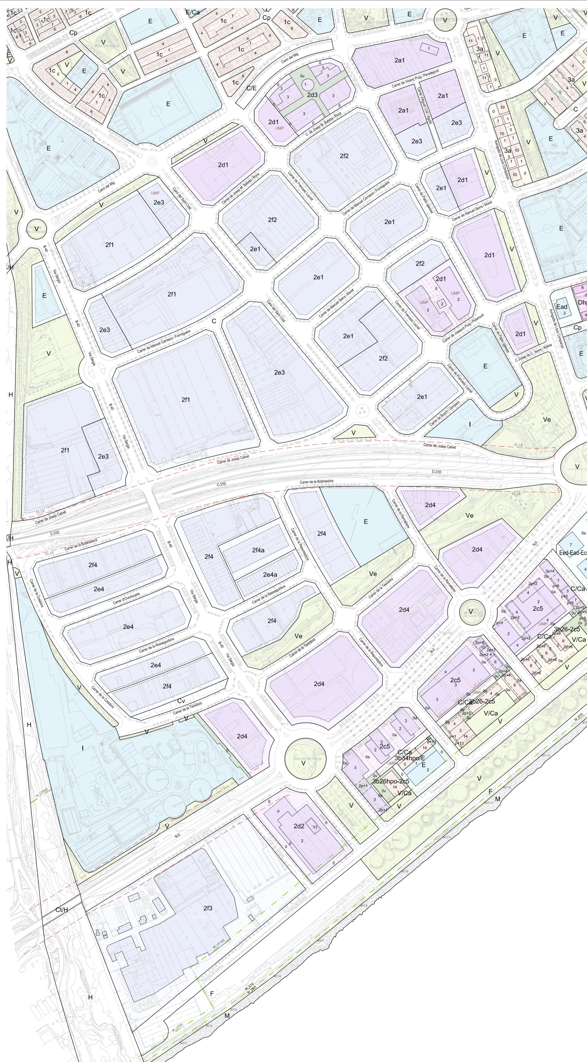
POLÍGONS INDUSTRIALS EL RENGLÉ I / LES HORTES CAMÍ RAL / PLA D'EN BOET I II