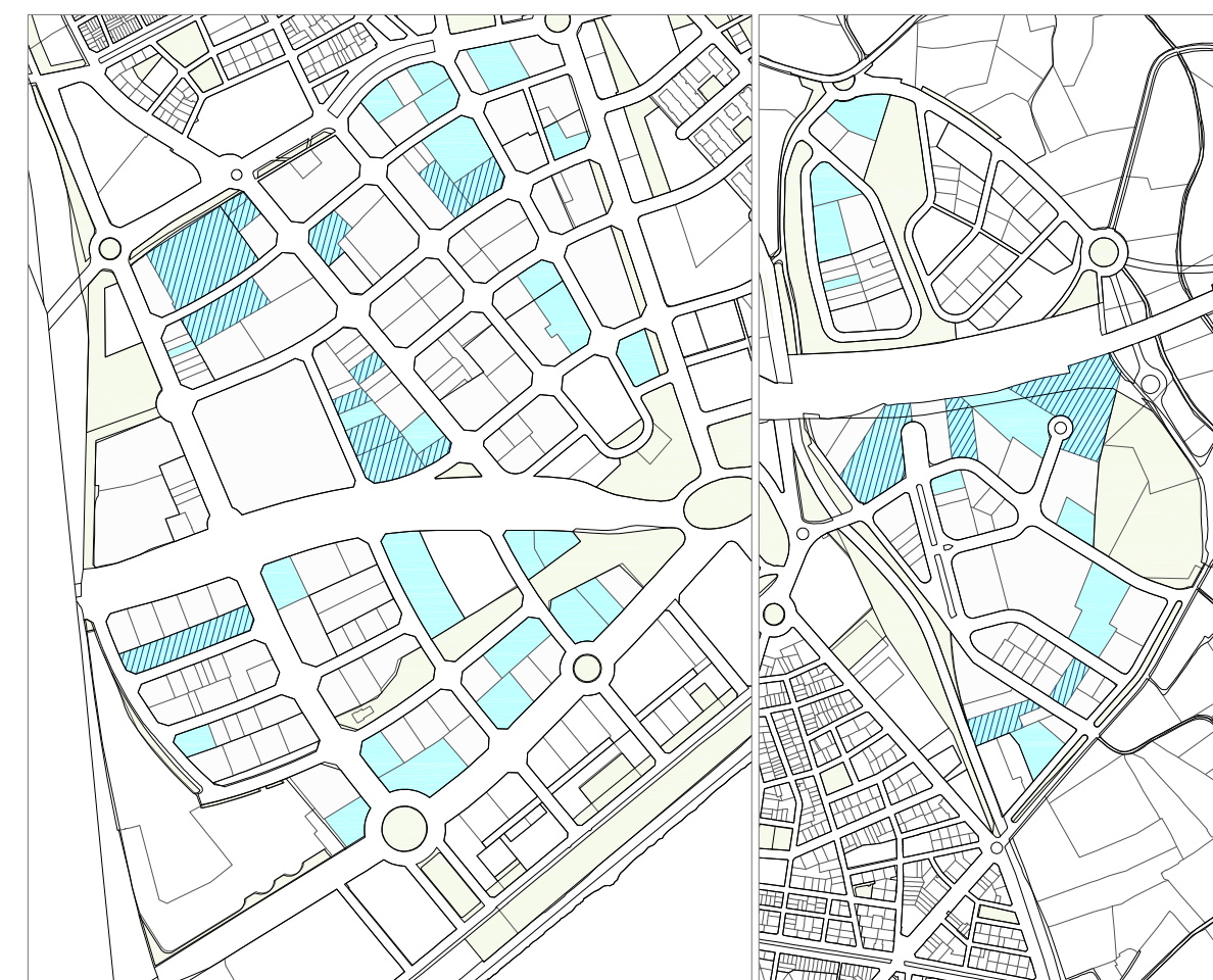
U2. Oficines d'empreses