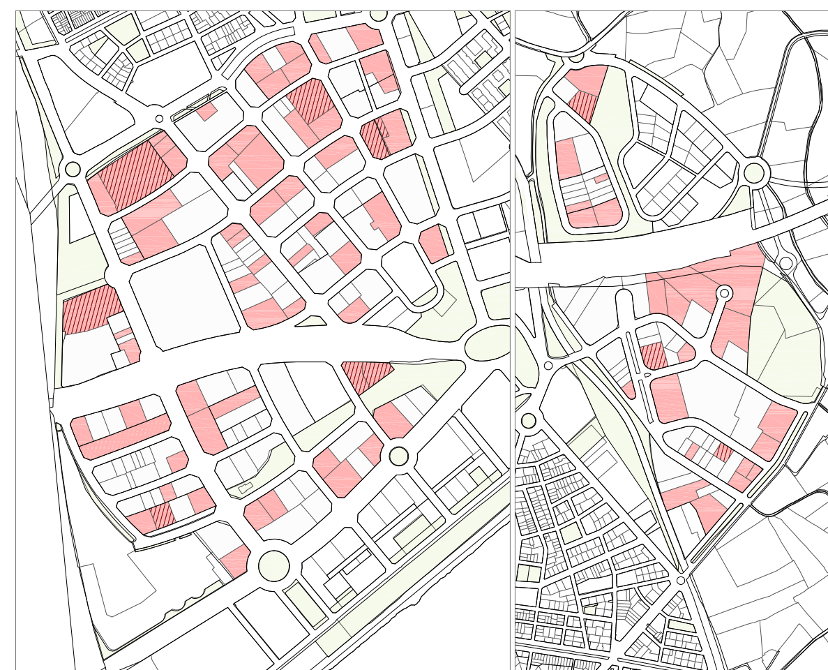
U3. Activitat comercial