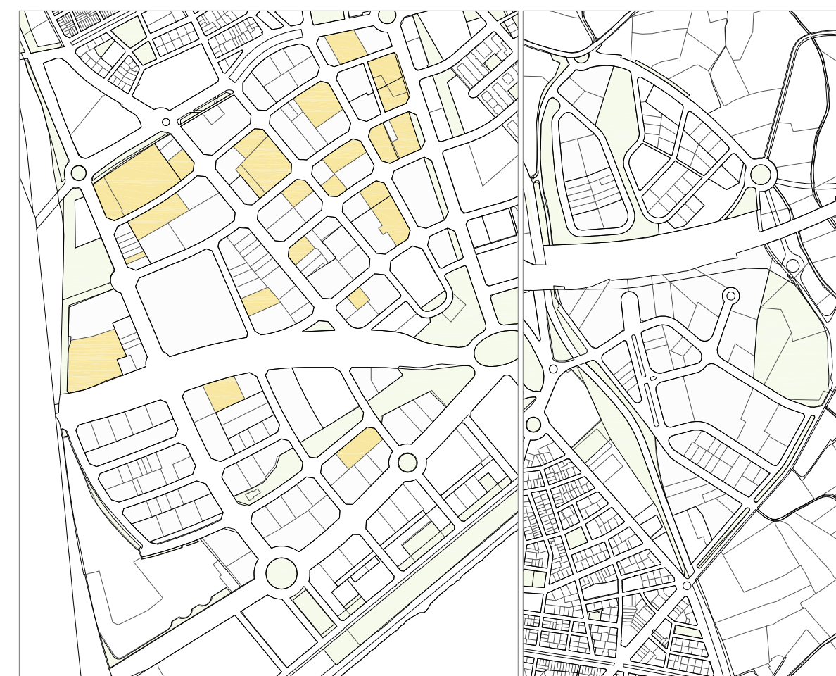
U4. Activitats recreatives