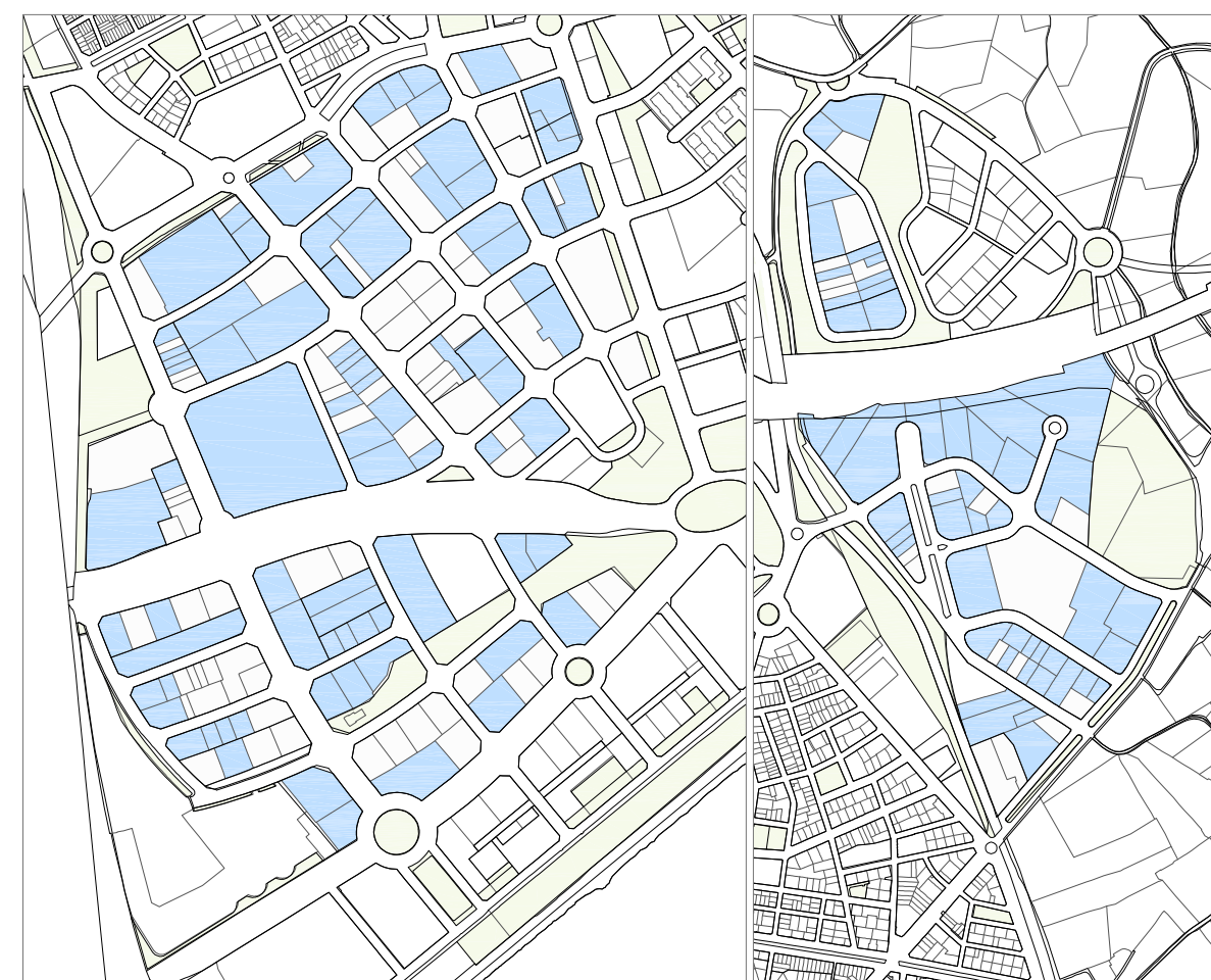
U1. Indústria i tallers