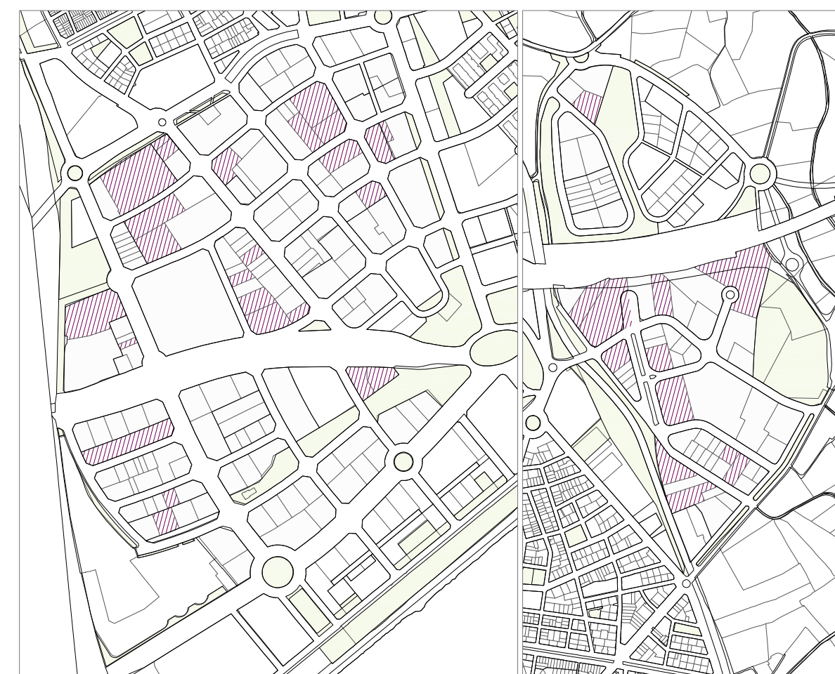
U7. Usos inadequats no vinculats a la indústria