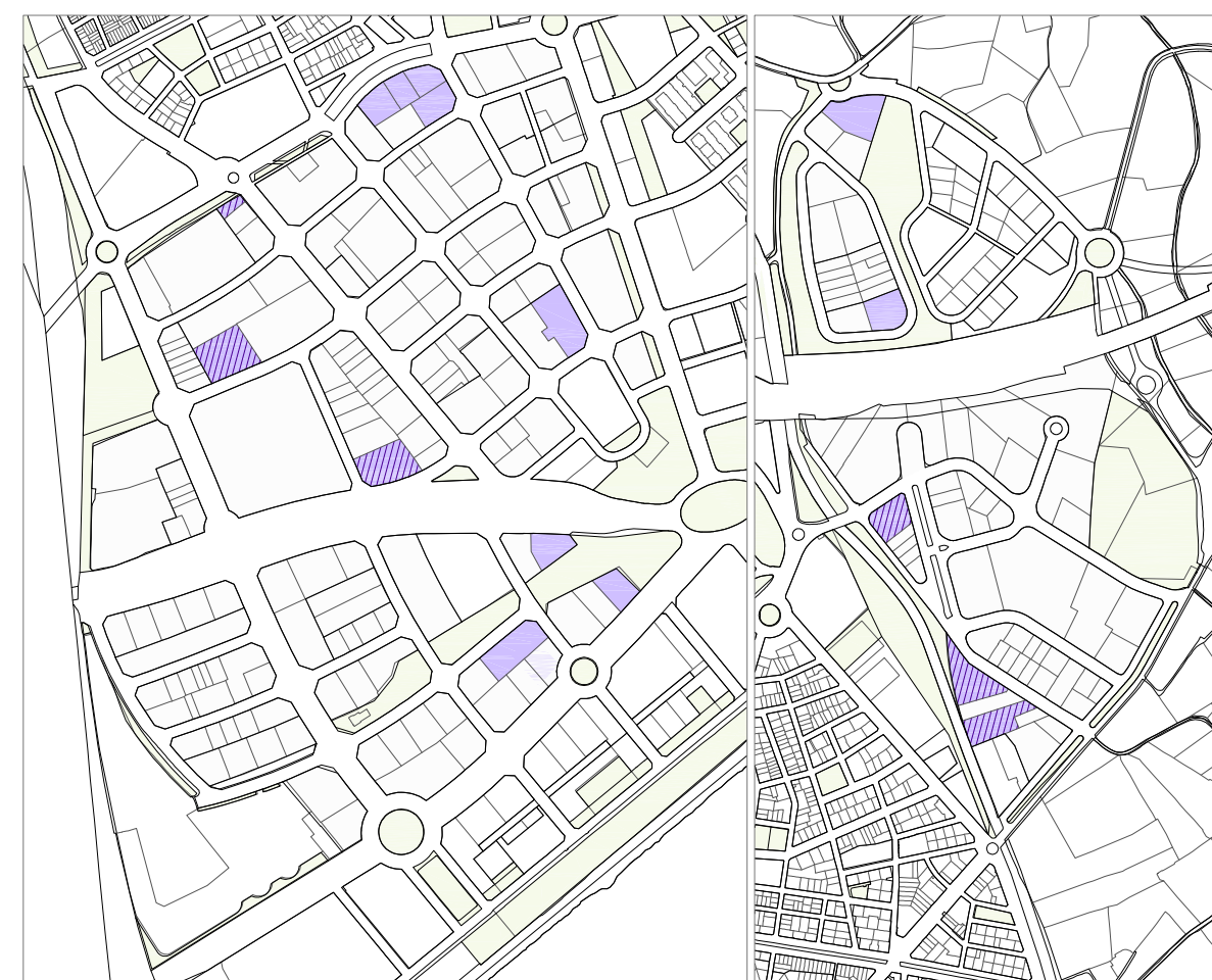
U6. Altres serveis compatibles