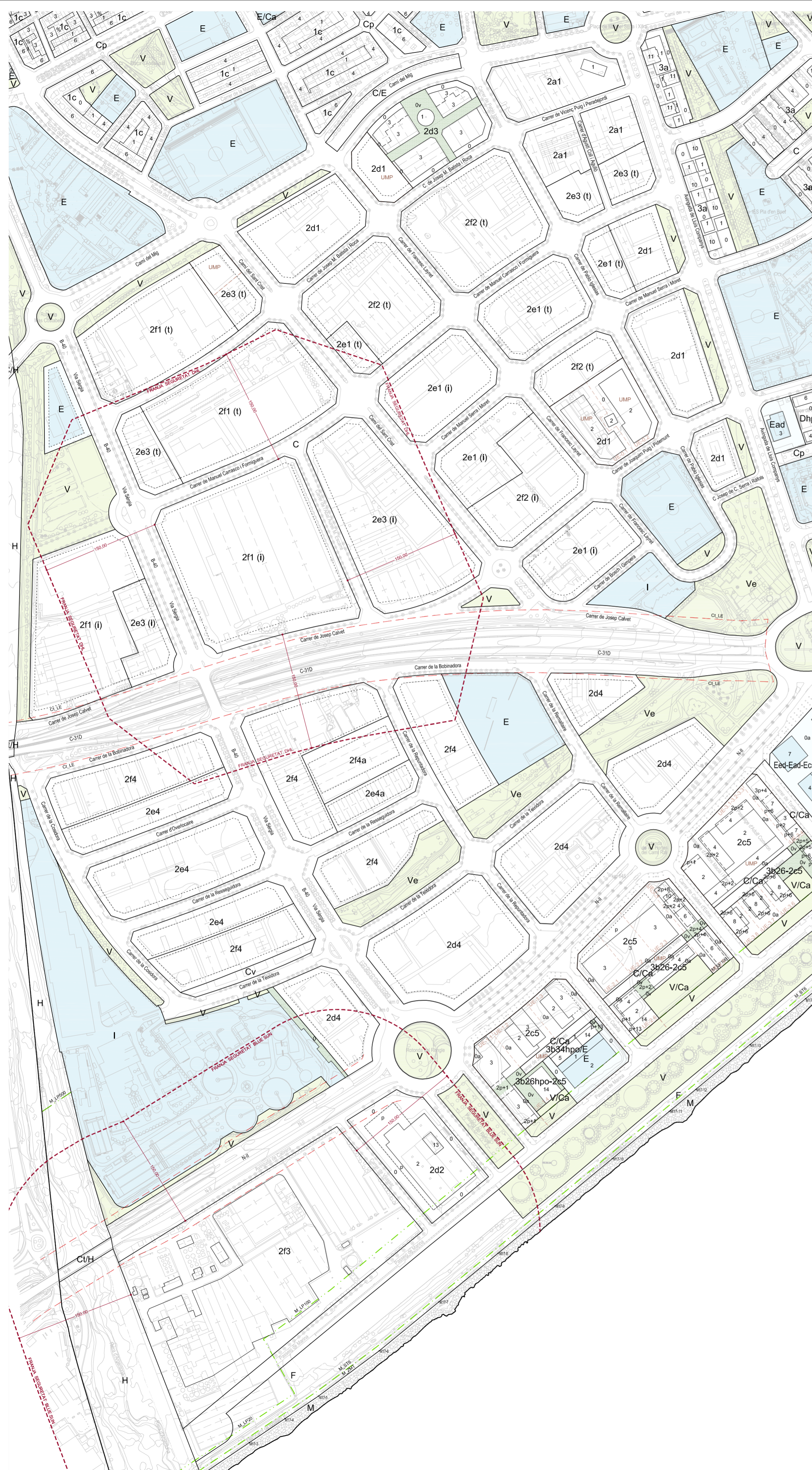
POLÍGONS INDUSTRIALS EL RENGLÉ I / LES HORTES CAMÍ RAL / PLA D'EN BOET I II