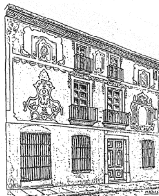
Façana esgrafiada de la casa núm. 9 del carrer d'En Moles. (segona meitat del segle XVIII). Desaparegut. Dibuix de Marià Ribas i Bertran.