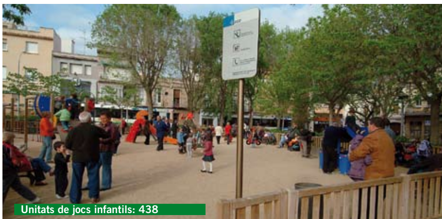
Unitats de jocs infantils: 438