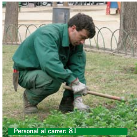
Personal al carrer: 81