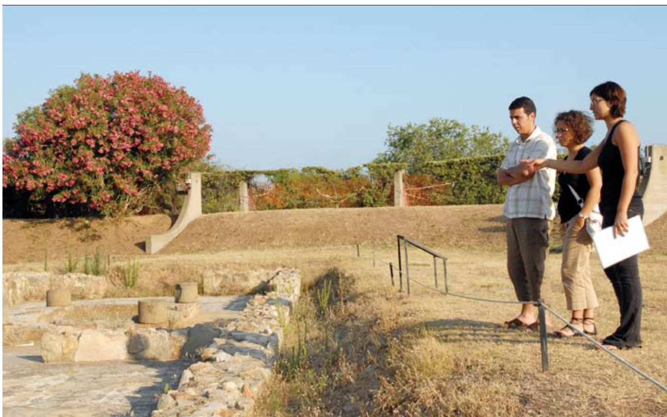
Una visita guiada a la Vil·la Romana de Torre Llauder, situada a l'avinguda Lluís Companys del Pla d'en Boet.

La celebració del Dia Internacional del Museu, el 18 de maig, s'inicia amb una conferència, el 16 de maig, sobre la pintura catalana del Barroc. Els mataronins també podran visitar els museus que faran una jornada de portes obertes.