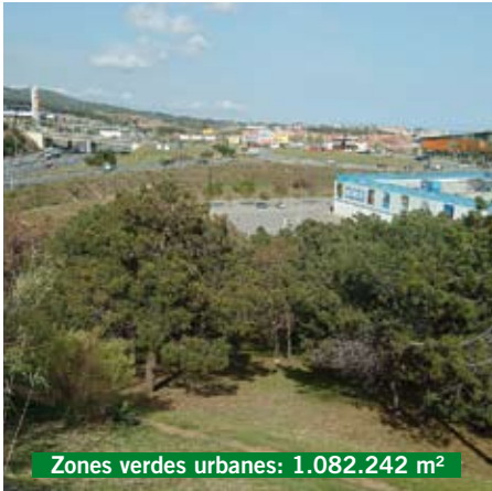
Zones verdes urbanes: 1.082.242 m 2