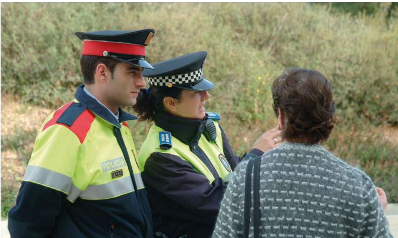
Les patrulles mixtes són un exemple de la coordinació entre la Policia Local i el Cos dels Mossos d'Esquadra.

El creixement de la ciutat i els canvis de la societat han portat a la Policia Local a dotar-se de noves eines de treball i de més recursos humans, materials i tecnològics. S'ha previst que hi hagi 207 policies l'any 2013.