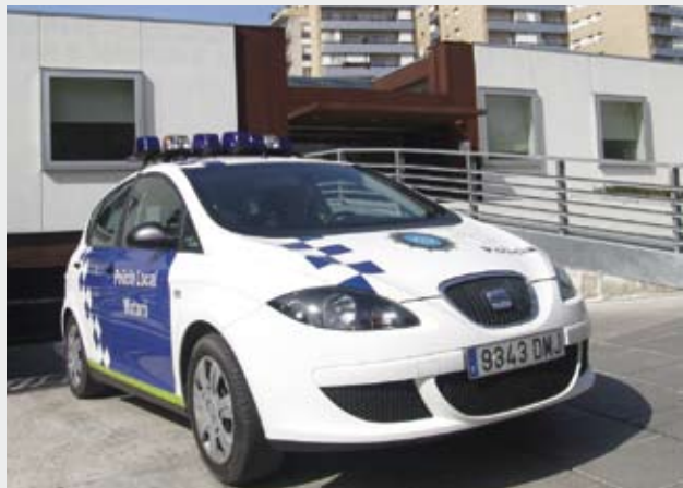
Un cotxe patrulla