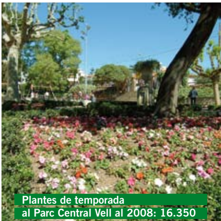
Plantes de temporada al Parc Central Vell al 2008: 16.350