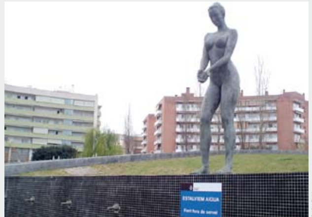
La font de la Plaça Itàlia atorada per sequera

Cal no abaixar la guàrdia. Hem de seguir treballant per reduir les dotacions a la ciutat que ens ve del riu Ter, amb l'estalvi, amb la recuperació en pocs mesos de nous pous i mines i com a objectiu a mig termini, la reutilització màxima de l'aigua tractada a la Depuradora de Mataró que té un potencial de 10 Hm 3 /any.