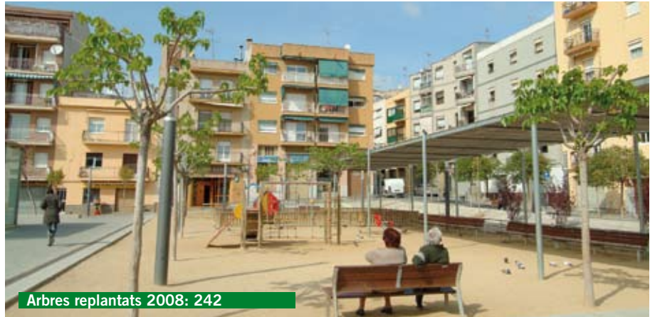
Arbres replantats 2008: 242