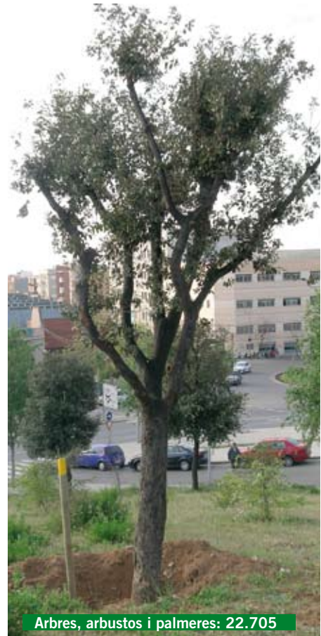
Arbres, arbusts i palmeres: 22.705