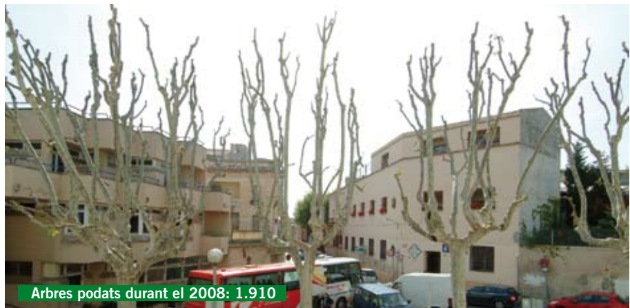
Arbres podats durant el 2008: 1.910