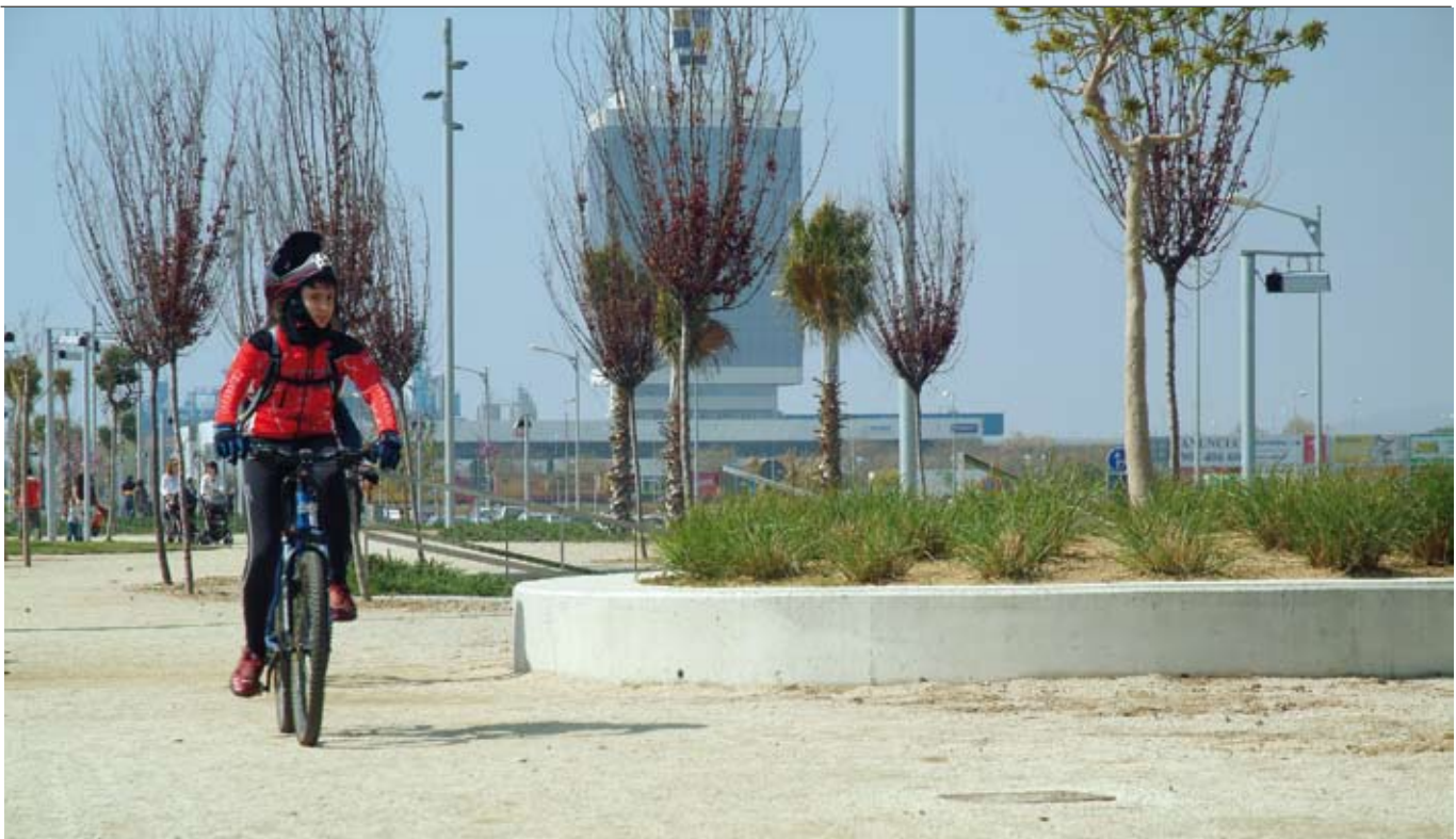
El Parc de Mar és un espai de 37.500 m 2 on els mataronins poden passejar, descansar i fer esport.

La ciutadania disposa d'1.082.242 m 2 de zones verdes. Un equip de 81 persones treballa per mantenir aquests espais que s'han adaptat al nou clima amb diferents accions com l'aplicació d'un sistema de reg intel·ligent.