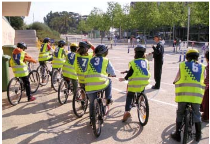
La Policia Local fa controls de trànsit, diligències en els accidents, regula el trànsit i educació viària, entre d'altres tasques.