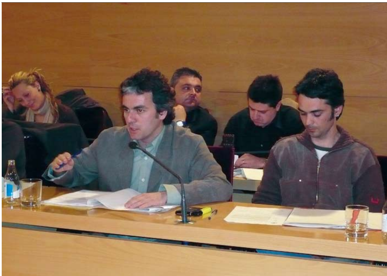
Un moment del Ple en el qual es va tractar la reforma dels patronats municipals de Cultura i d'Esports.