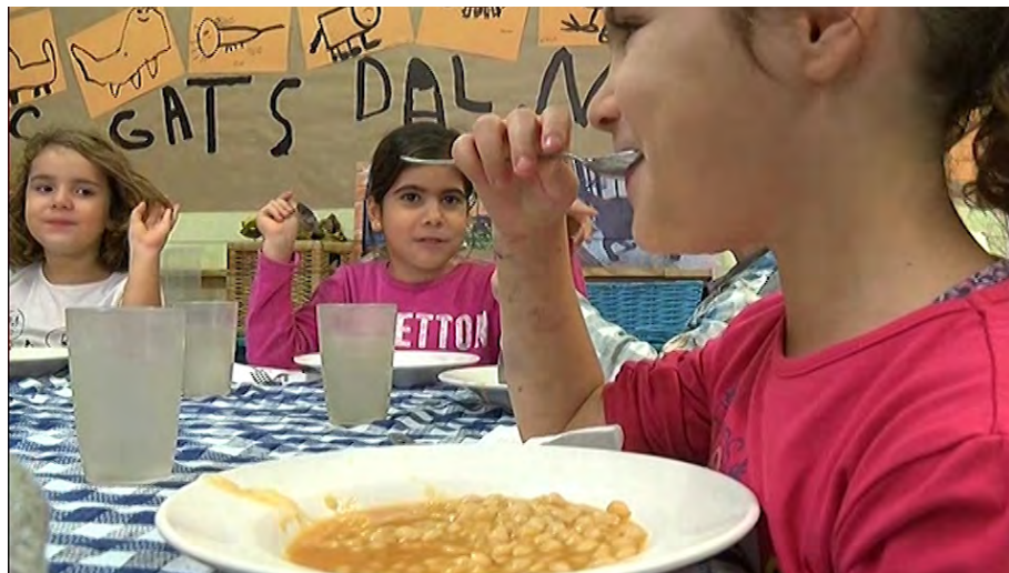
L'educació alimentària és un dels temes d'aquesta temporada

Aquesta és la vuitena temporada del programa als canals de televisió de proximitat i la segona a les emissores locals. A través