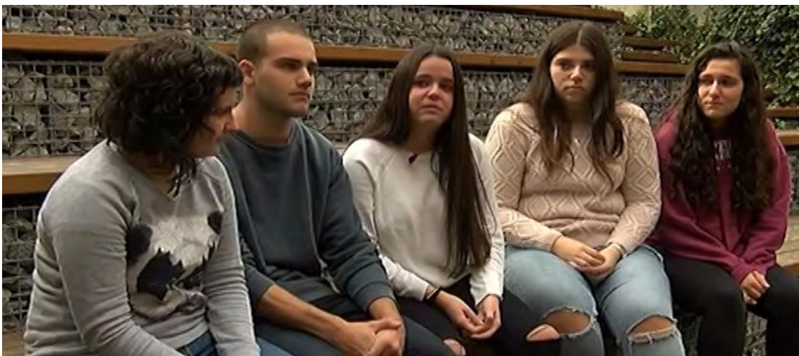
Joves participants en el capítol sobre el dol.

Quan els pares se separen hi ha un trencament dels lligams afectius que és sempre dolorós i que els fills poden viure amb angoixa. En aquest capítol exposarem com influeix la separació segons l'edat dels fills i els factors que poden agreujar o augmentar el procés emocional que hi va lligat.