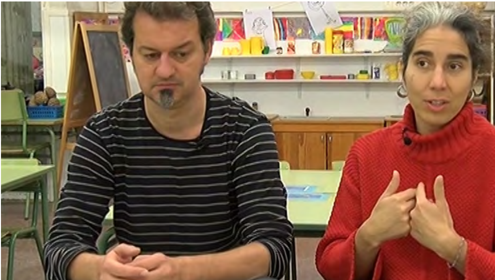
Pares testimoni del capítol sobre educació artística