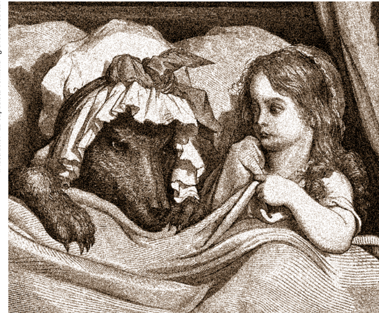
Il·lustració: "La capubeta vermella" gravat de Gustave Doré (1832-1883)