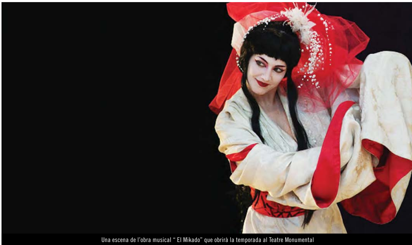
Una escena de l'obra musical "El Mikado" que obrirà la temporada al Teatre Monumental

La nova programació de teatre i dansa després de les obres de reforma anirà de novembre a maig de 2007. Com a novetat hi haurà activitats complementàries i un sol abonament de temporada, que suposa un descompte del 40%.