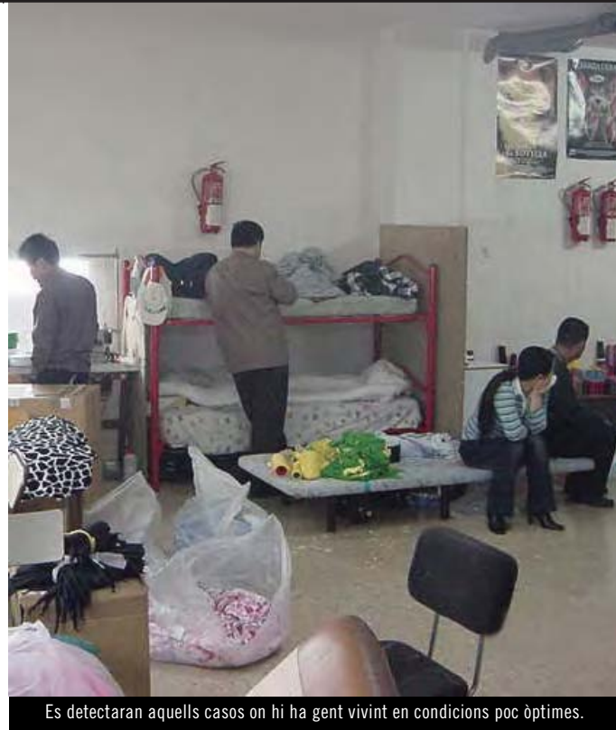
Es detectaran aquells casos on hi ha gent vivint en condicions poc òptimes.