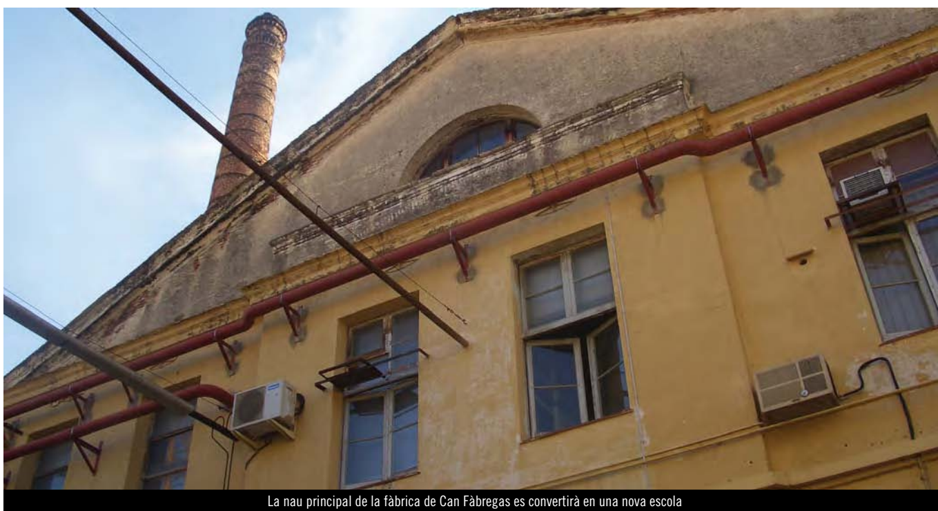
La nau principal de la fàbrica de Can Fabregas es convertirà en una nova escola