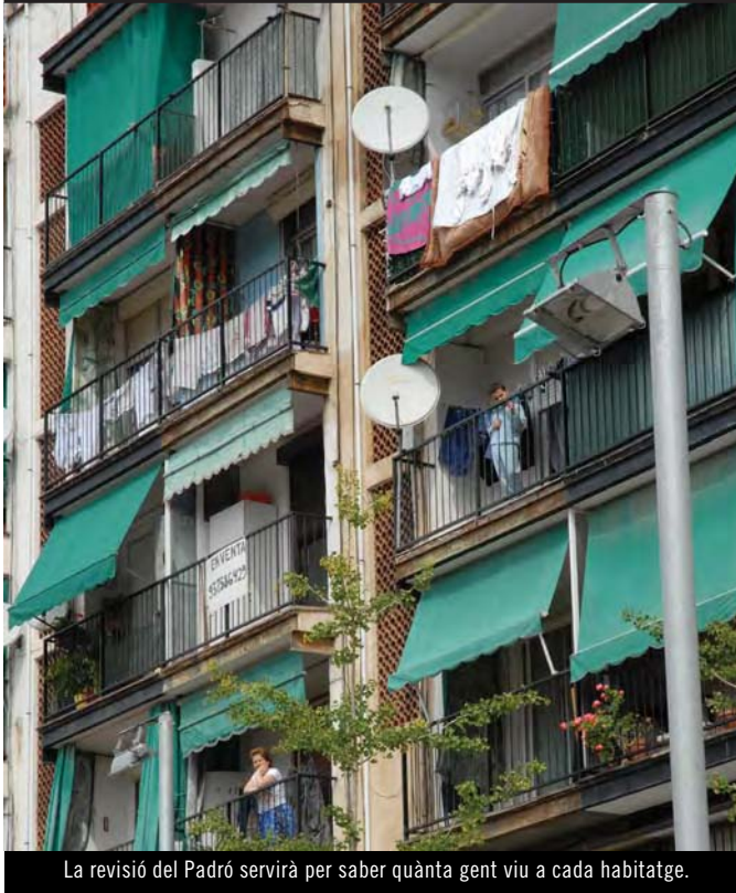
La revisió del Padró servirà per saber quanta gent viu a cada habitatge.