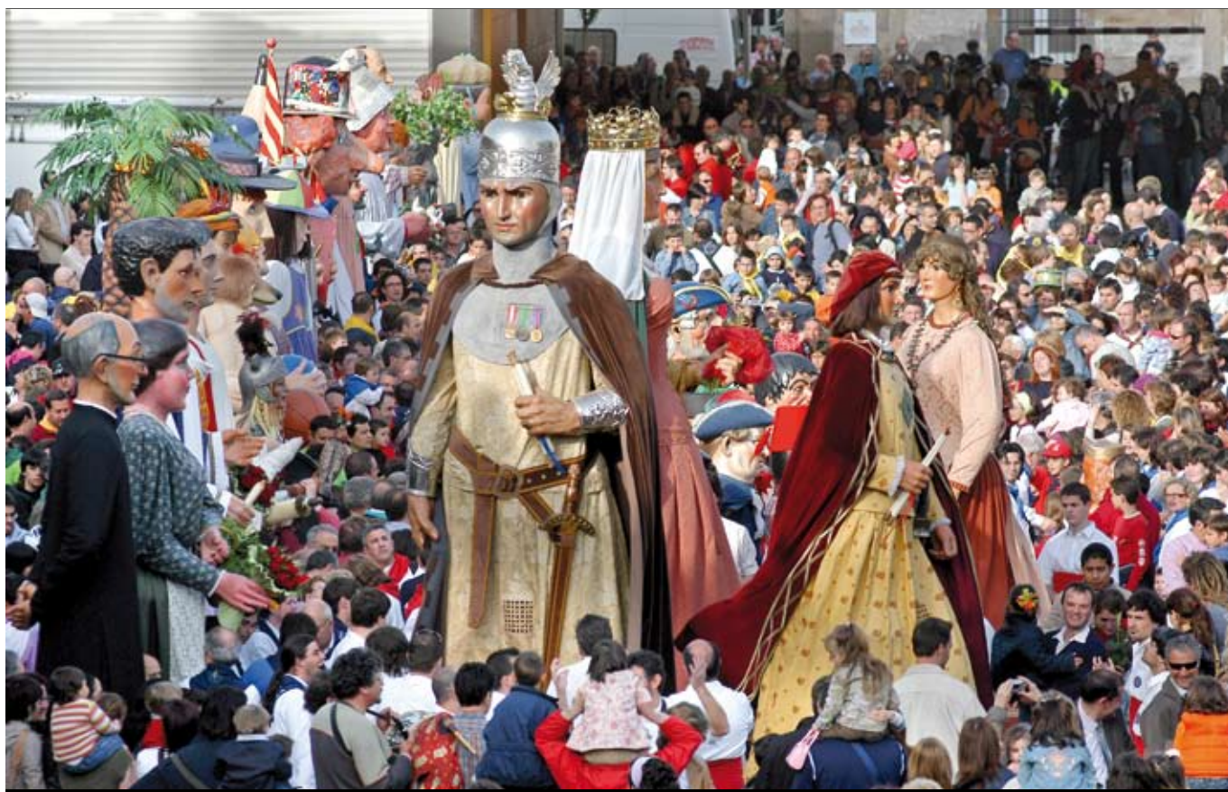
La cercavila de tots els gegants i nans de la ciutat és un dels actes més multitudinaris de la Diada de Sant Jordi