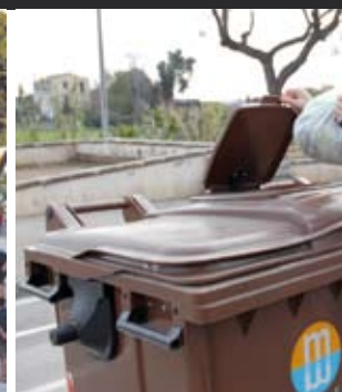
RECOLLIDA DE MA