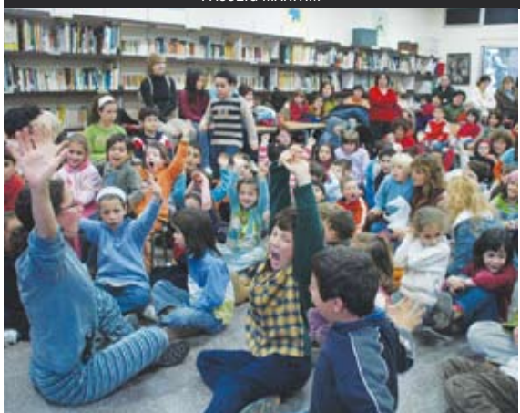
PLANS EDUCATIUS D'ENTORN