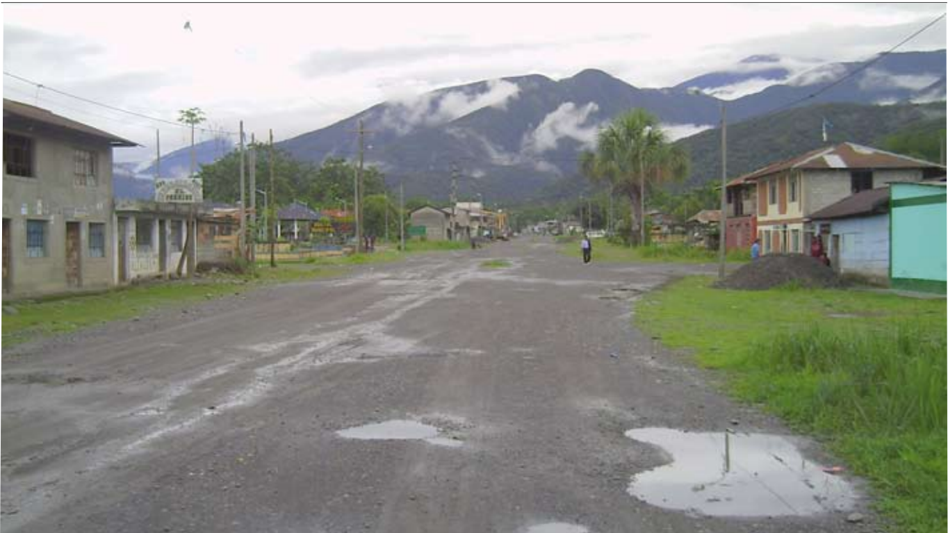
San Gabán és un poble situat en una de les zones més pobres del Perú on s'hi està desenvolupament un projecte subvencionat per Mataró

La Nit de la Solidaritat arriba a la desena edició amb convidats de renom. Des del 2003 Mataró destina anualment l'1% dels seus ingressos a programes de solidaritat. El 2006 l'Ajuntament ha aportat quasi 500 mil euros a projectes de cooperació al desenvolupament i de sensibilització.