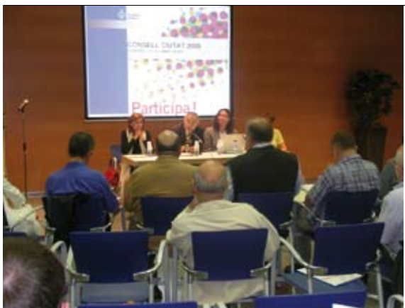
CONSELL DE CIUTAT