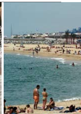
PLATJA DEL V