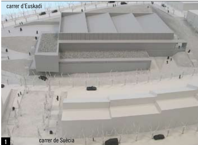
carrer de Suècia