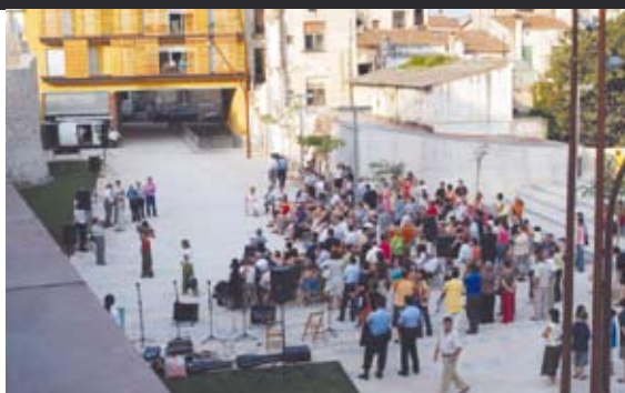
PLAÇA DEL POU D'AVALL