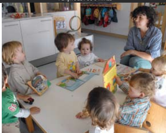
ESCOLA BRESSOL EL TABALET