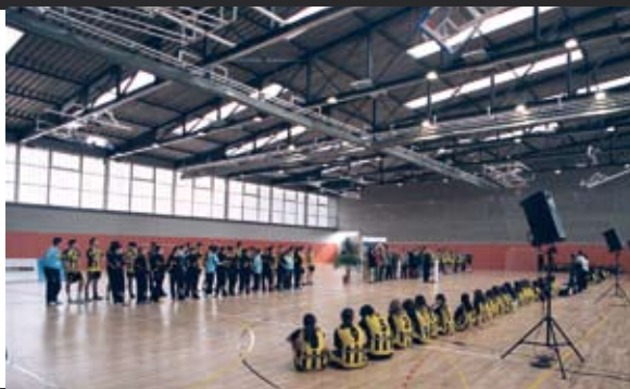
POLIESPORTIU TERESA M. ROCA I VALLMAJOR