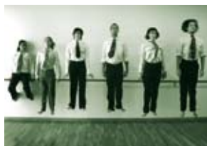
Teatre "El salt de Nijinsky"