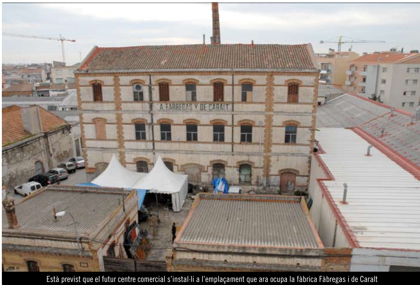
Està previst que el futur centre comercial s'instal·li a l'emplaçament que ara ocupa la fàbrica Fàbregas i de Caralt