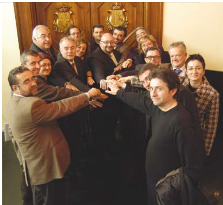
PACTE PER AL DESENVOLUPAMENT