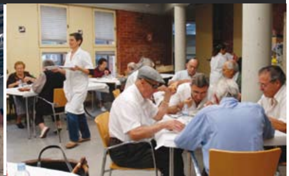
MENJADOR DE GENT GRAN DE Cerdanyola