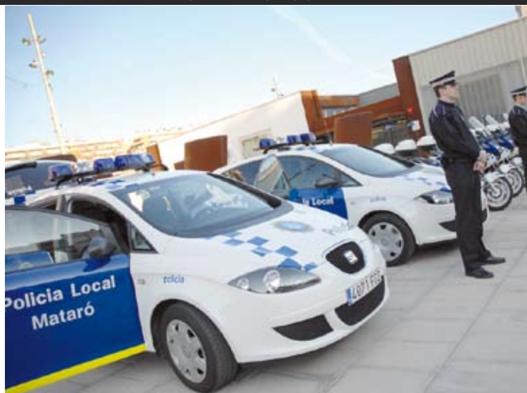
NOUS EQUIPAMENTS POLICIA LOCAL

acord s'han tirat endavant les primeres accions del Pla de promoció de ciutat (oficina de turisme, senyalització i rutes, difusió de la marca “Mataró, ciutat mediterrània”) i s’han pres mesures de suport al tèxtil local (programes de recol·locació de treballadors, internacionalització, formació, tecnologia i innovació). A més, han començat les obres del parc tecnològic TecnoCampusMataró, on conviuran les dues escoles universitàries, empreses de noves tecnologies i institucions de l’àmbit de les TIC, amb la voluntat de crear sinergies positives entre coneixement, innovació i empresa.