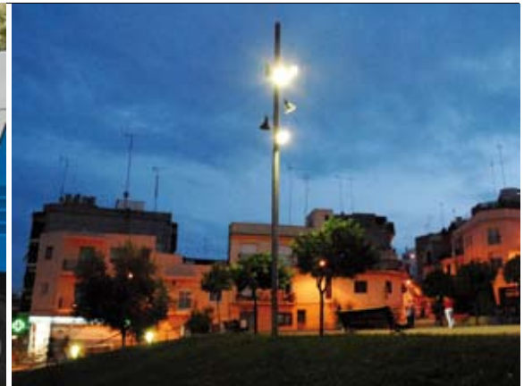
ENLLUMENAT A LA LLÀNTIA