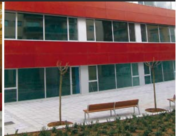
CENTRE CÍVIC PLA D'EN BOET

escola Anxaneta i el CEIP Antonio Machado, el centre de nous creadors de Can Xalant i el centre d'art Ca l'Arenas.