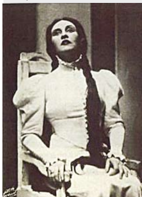
Teatre "El Dibbuq"