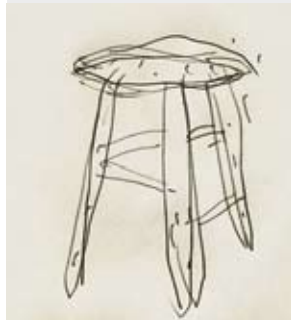
Exposició "El tamboret blanc"