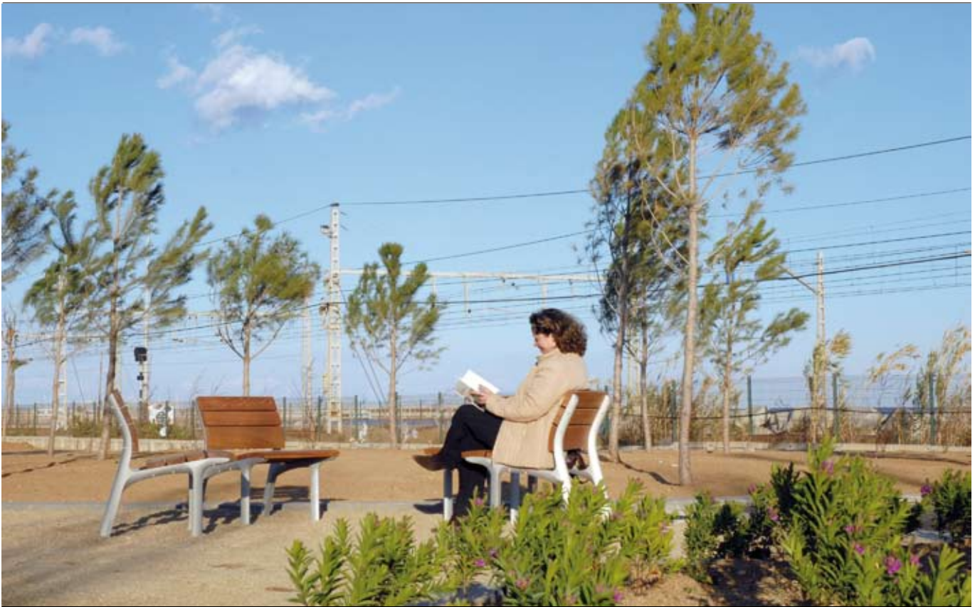
El Parc de Mar té zones d'estada, jocs infantils, i una escultura anomenada "Ondulacions"

El desenvolupament de front de mar ha estat clau en els últims 4 anys, juntament amb l'augment dels equipaments, aparcaments i habitatges de promoció pública a la ciutat. També han començat a fer-se realitat els projectes lligats al Pacte per al Desenvolupament Econòmic i Social.