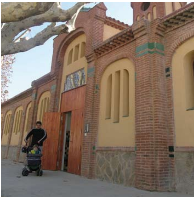
ESCOLA BRESSOL MUNICIPAL ELS MENUTS