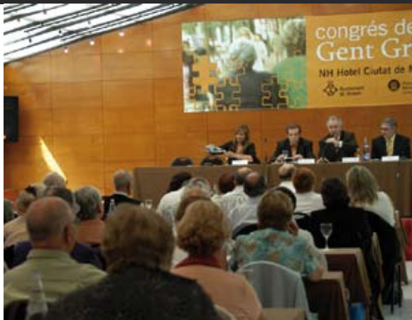
CONGRÉS DE LA GENT GRAN