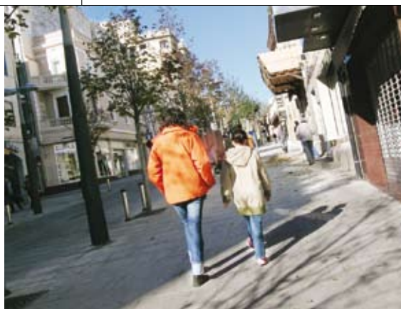
ZONA DE VIANANTS DE LA RIERA