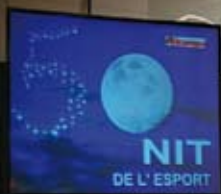
50 anys de Nit de l'Esport