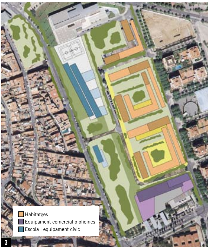
© INSTITUT CARTOGRÀFIC + AJUNTAMENT 3

A mitjan de desembre va finalitzar la quarta edició del taller d'ocupació "Serveis d'atenció socio sanitària a persones dependents" de l'Institut Municipal de Promoció Econòmica. El programa dura un any i hi han participat 24 dones, majors de 25 anys en atur, que s'han format en les ocupacions de treballadores familiars, auxiliars de gerontogeriatria i auxiliars de la llar. Durant l'any, les alumnes-treballadores han realitzat més de 700 hores de formació teoricopràctica i més de 600 hores de treball en diferents entitats, serveis o institucions de la ciutat. En aquesta edició més de la meitat de les participants s'han incorporat ja al món laboral i de la darrera edició s'ha aconseguit una inserció del cent per cent.