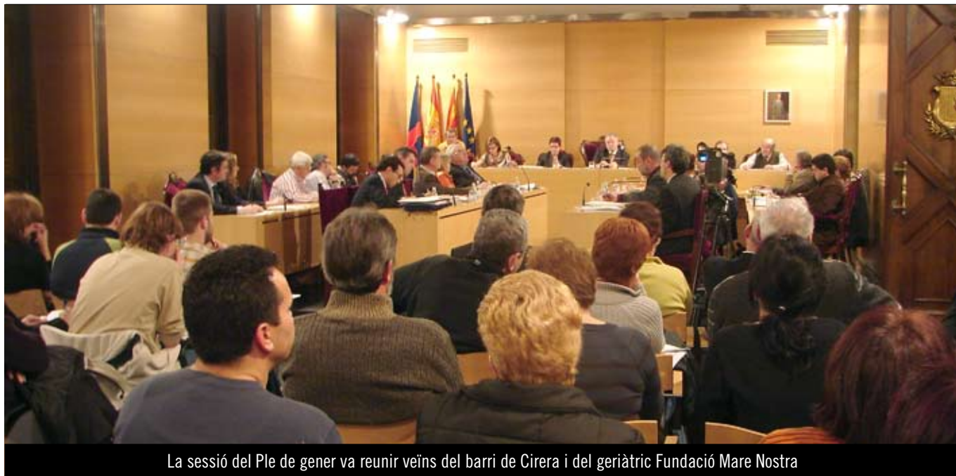
La sessió del Ple de gener va reunir veïns del barri de Cirera i del geriàtric Fundació Mare Nostra