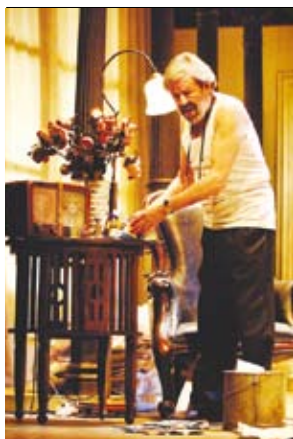
Teatre. Visitando al Sr. Green