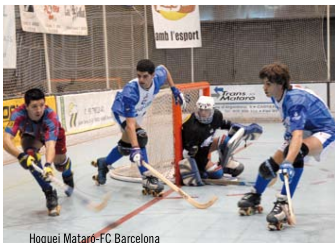
Hoquei Mataró-FC Barcelona