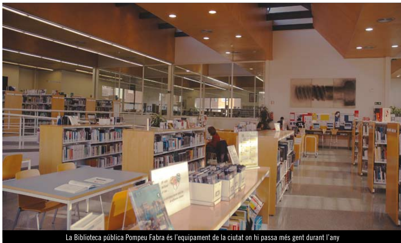
La Biblioteca pública Pompeu Fabra és l'equipament de la ciutat on hi passa més gent durant l'any

El Museu de Mataró acull una exposició que explica les línies de treball en matèria cultural que s'estan duent a terme a la ciutat i també les futures. L'exposició es pot veure del 9 al 25 de febrer.