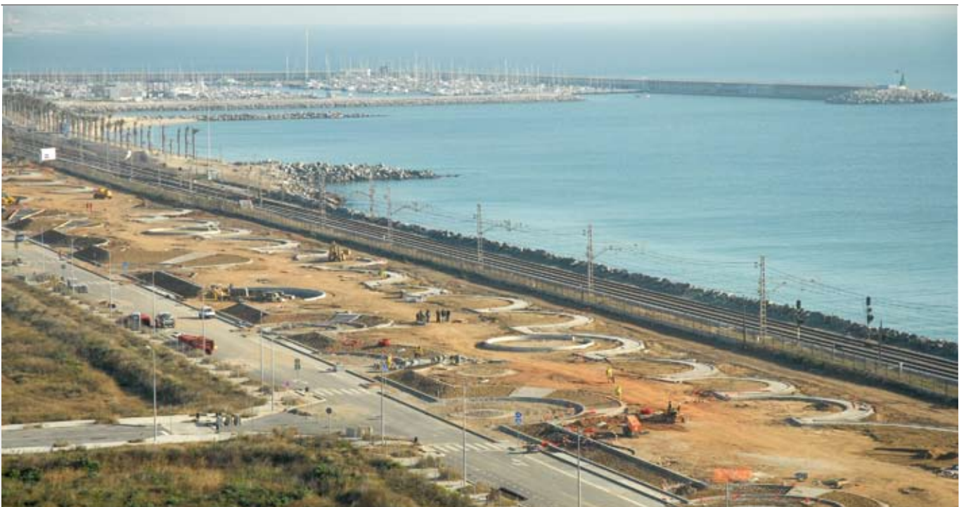
Aquest any es fa realitat el nou parc de Mar, la gran zona enjardinada situada junt al futur TecnoCampusMataró, al sector del Rengle

Habitatge assequible, noves places d'aparcament i més equipaments centren les prioritats del Programa d'Actuació Municipal, que incorpora propostes de grups municipals, entitats, associacions de veïns i particulars i està dotat d'un pressupost un 23% més gran que l'any passat.