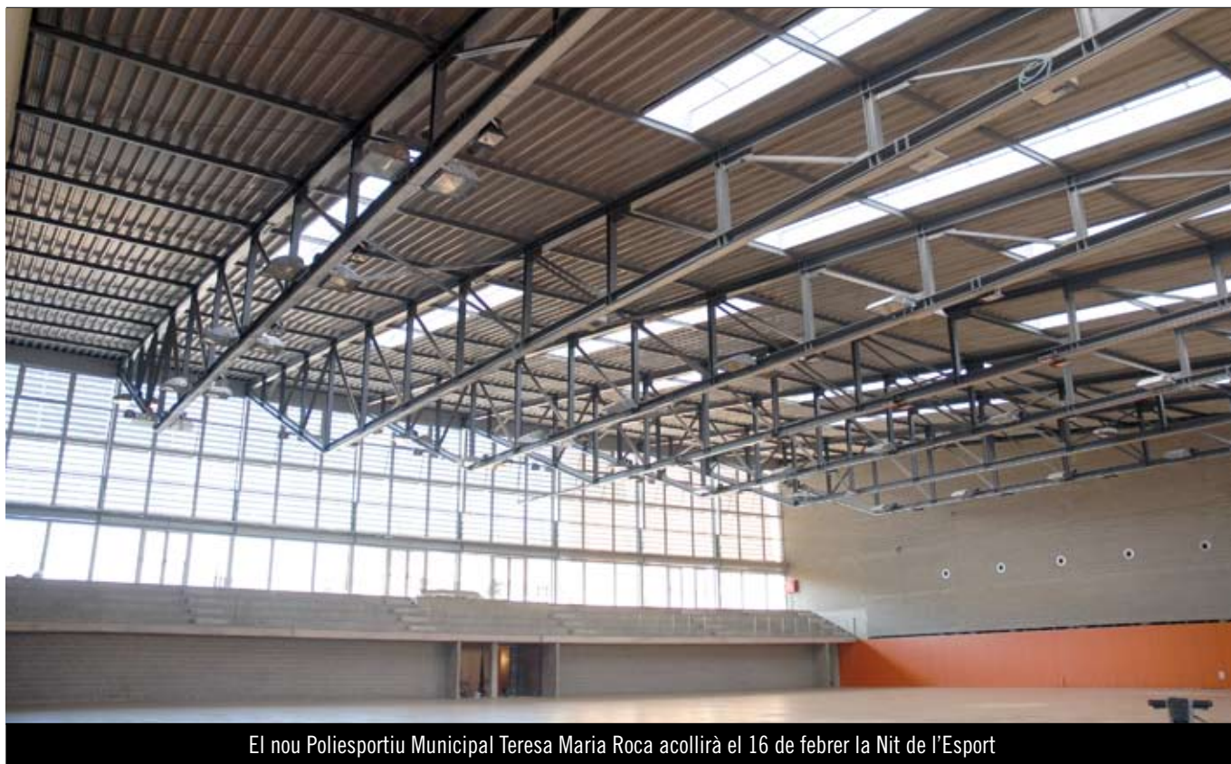
El nou Poliesportiu Municipal Teresa Maria Roca acollirà el 16 de febrer la Nit de l'Esport

El Patronat Municipal d'Esports treballa des de l'esport de base amb els escolars fins a la competició amb els clubs federats. El 18 de febrer s'inaugura el Poliesportiu Municipal Teresa Maria Roca, a Cirera.