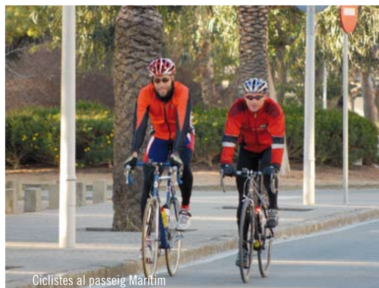
Ciclistes al passeig Marítim

La Nit de l'Esport d'enguany serà l'acte que estrenarà el nou poliesportiu. La festa serà el 16 de febrer. La Nit de l'Esport premia els esportistes locals més destacats de l'any.