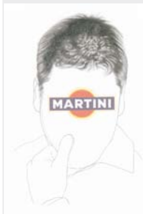
Exposició. Xavier Roldan