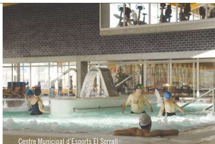
Centre Municipal d'Esports El Sorrall