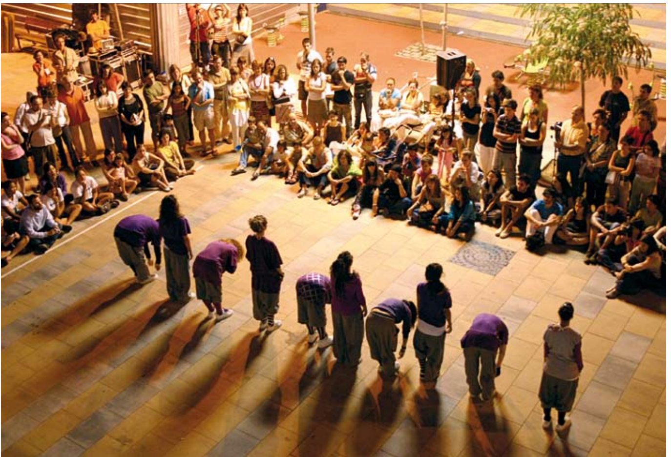
Sound System Dance Crew va ser una de les 4 companyies mataronines participants en el festival

Va tenir lloc el 29 de juny i hi van participar 10 companyies, 4 de les quals eren de Mataró. El festival forma part del Barcelona Grec Festival.