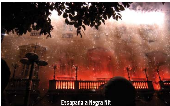
Escapada a Negra Nit