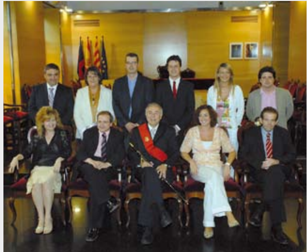
Grup Municipal del PSC el dia de constitució del nou Ajuntament

Mirin, ahir al vespre, després de força dies de parlar-ne a fons, el PSC ( http://mataro.socialistes.cat/ ), ICV-EUiA i ERC, van signar un acord per governar aquests propers quatre anys. Aquest nou pacte aborda sense massa pèls a la llengua això que els deia: És a dir, proposa més habitatge accessible als joves de Mataró, més integració de la immigració; una aposta decidida per les estratègies que entre tots hem definit pel futur de la ciutat, una ciutat que volem més innovadora i culta; una atenció prioritària a la qualitat de l'espai públic, més segur i més net, amb més aparcament i més equipaments; un pas endavant en el civisme, en les