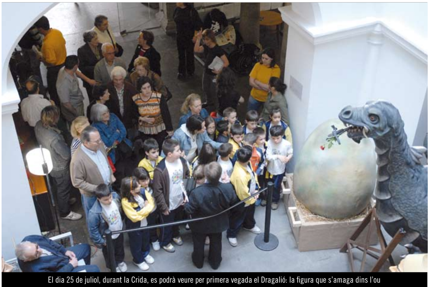
El dia 25 de juliol, durant la Crida, es podrà veure per primera vegada el Dragalió: la figura que s'amaga dins l'ou

La festa que reuneix més gent durant l'any comença el 20 de juliol i finalitza el 29 de juliol. L'edició d'enguany de Les Santes inclou més activitats infantils, musicals i de teatre, el naixement d'una nova figura, el Dragalió, i un nou acte anomenat "No n'hi ha prou!" per allargar la nit del 28. Per primera vegada es podrà consultar el programa a través dels telèfons mòbils.