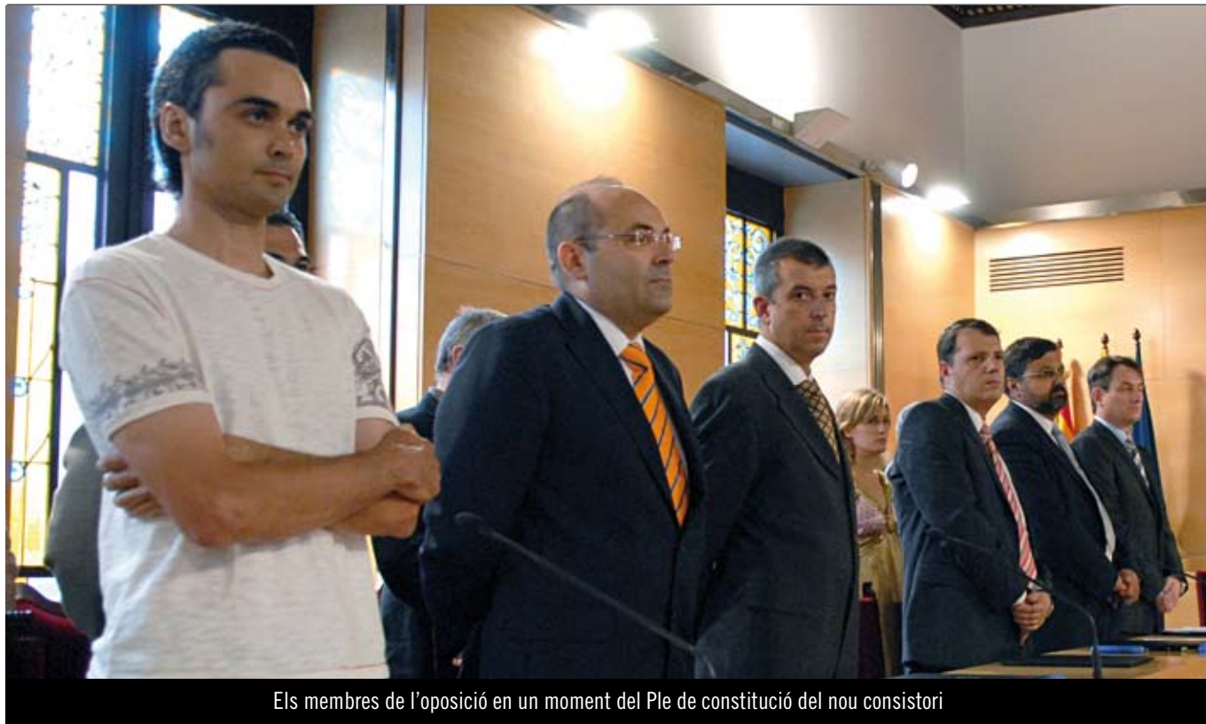
Els membres de l'oposició en un moment del Ple de constitució del nou consistori