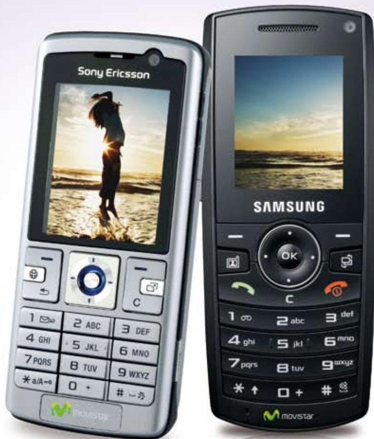
Sony Ericsson K610i