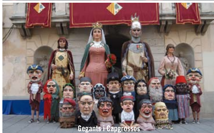
Gegants i Capgrossos