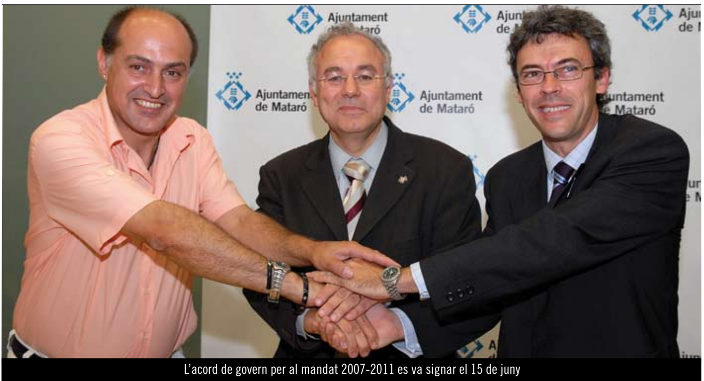
L'acord de govern per al mandat 2007-2011 es va signar el 15 de juny