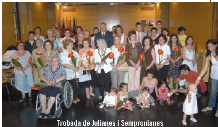
Trobada de Julianes i Sempronianes