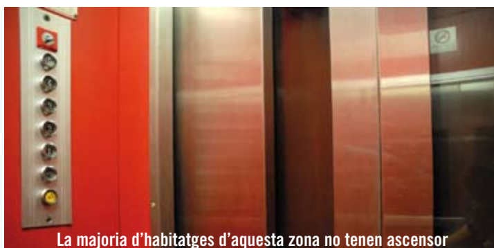
La majoria d'habitatges d'aquesta zona no tenen ascensor