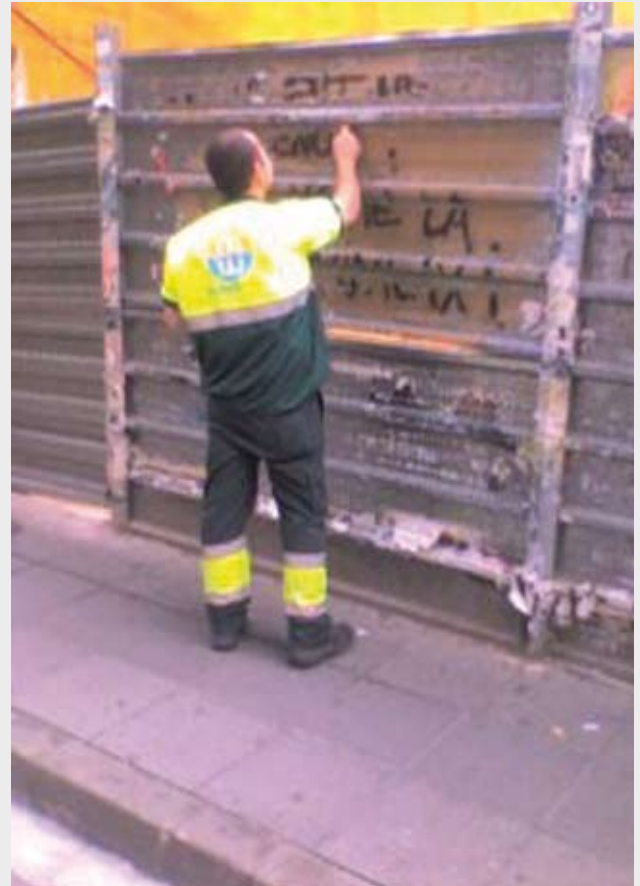
Un operari de l'Ajuntament arrenca un cartell enganxat correctament, tot obeint ordres superiors

Des de la CUP demanem més diàleg amb el teixit associatiu. Volem que es posi fi a la privatització i el control autoritari de l'espai públic; per tant, demanem una revisió de l'Ordenança del Civisme. I, finalment, apostem per afavorir l'ús participatiu de les nostres places i carrers, i per tal