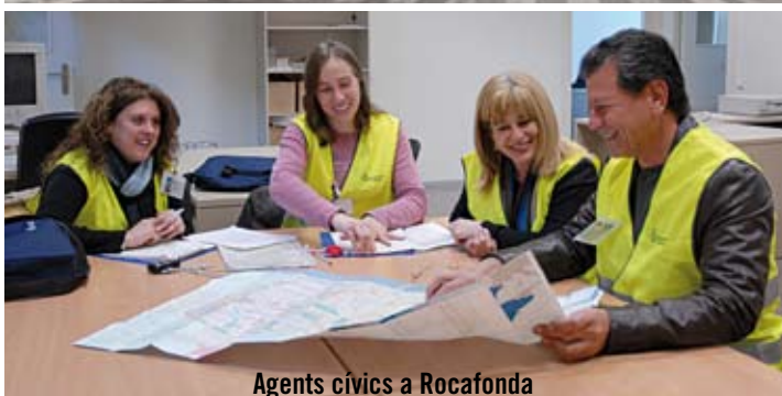
Agents cívics a Rocafonda