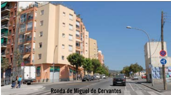
Ronda de Miguel de Cervantes