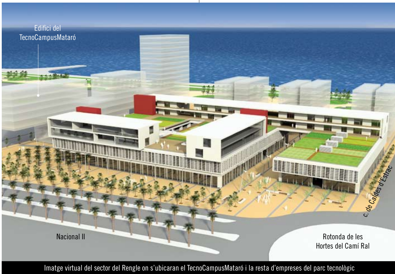
Imatge virtual del sector del Rengle on s'ubicaran el TecnoCampusMataró i la resta d'empreses del parc tecnològic