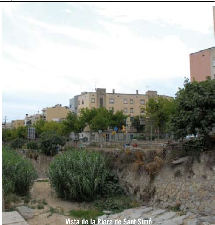
Vista de la Riera de Sant Simó