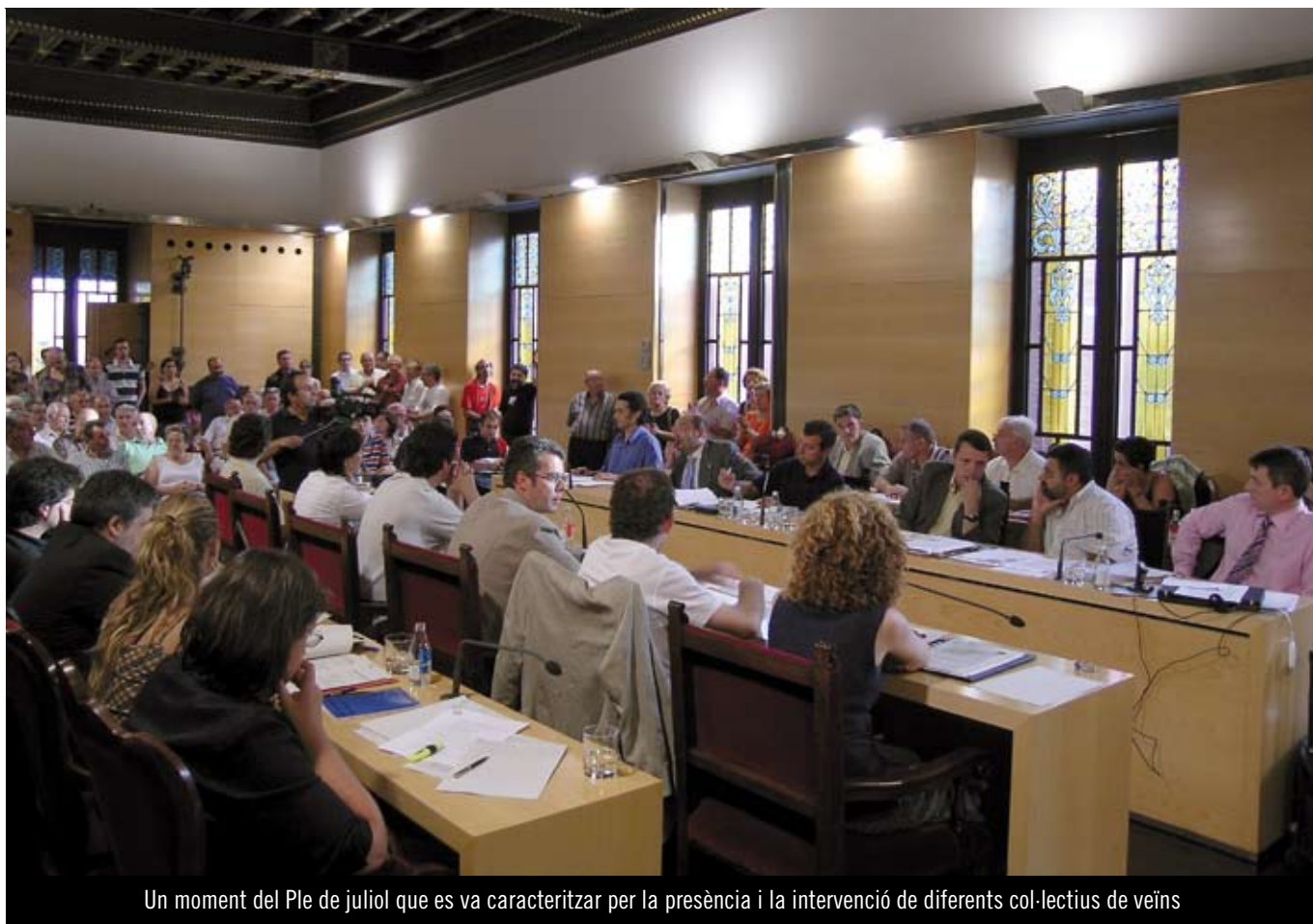
Un moment del Ple de juliol que es va caracteritzar per la presència i la intervenció de diferents col·lectius de veïns