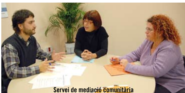
Servei de mediació comunitària