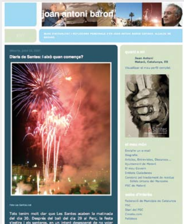
El bloc de Baron, http://joanantonibaron.blogspot.com