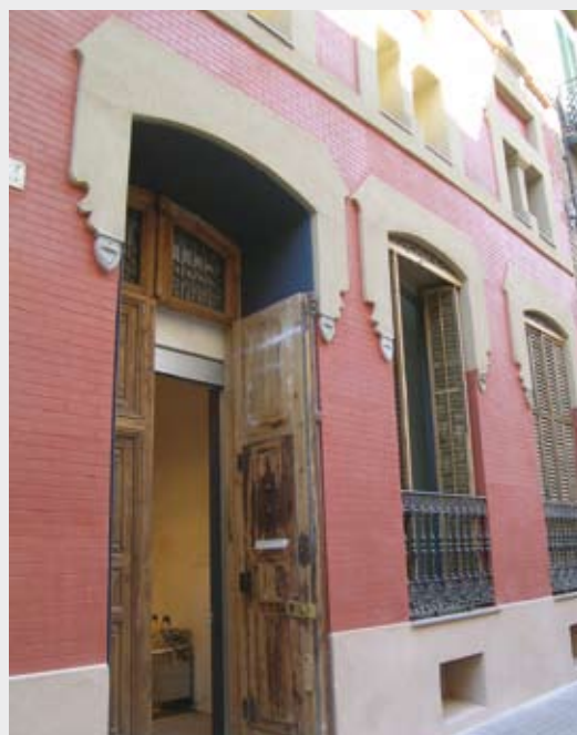
Ca l'Arenas. Centre d'art del Museu de Mataró

Resultat dels tallers entorn del retrat del servei pedagògic de la temporada 2006-2007.