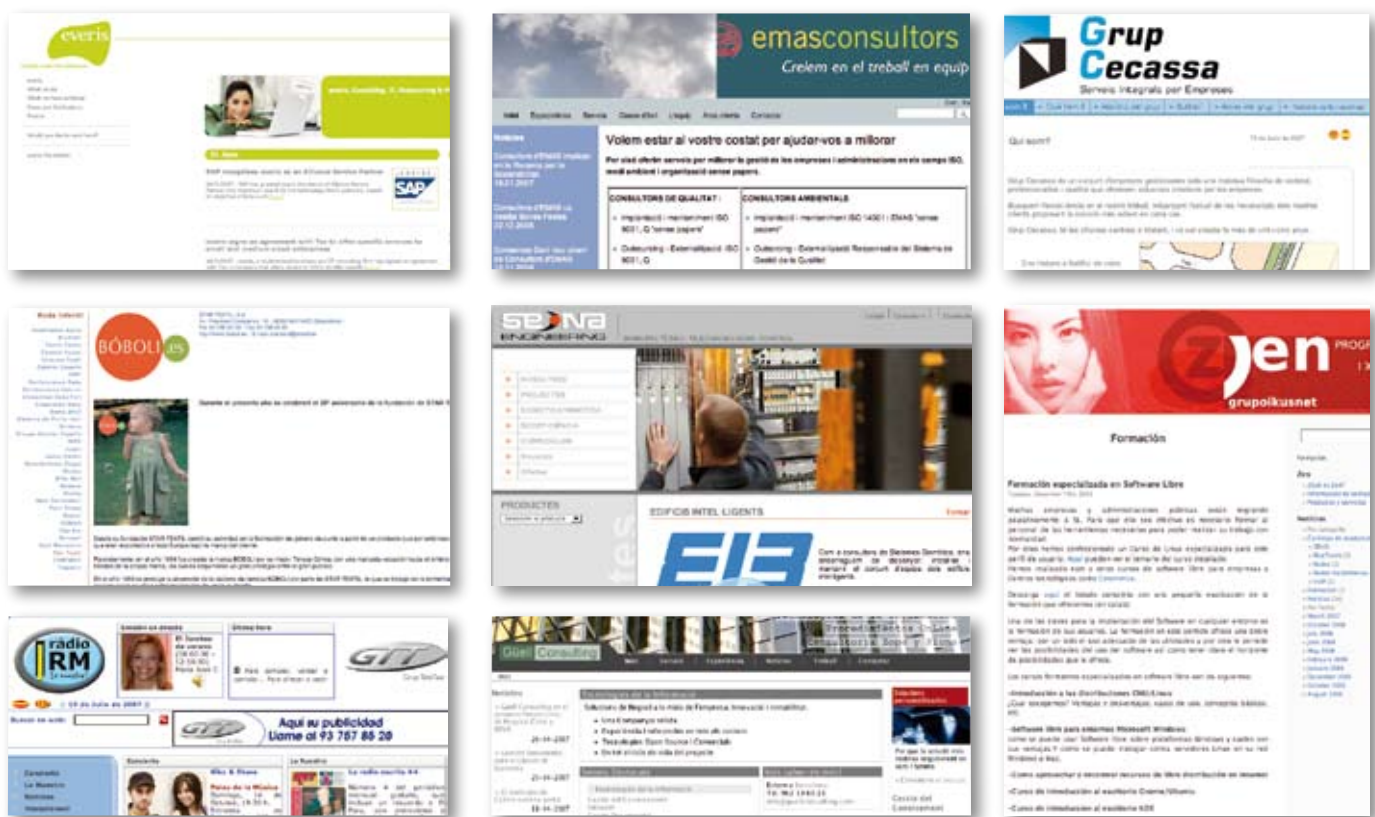
Pàgines webs d'algunes de les empreses que s'ubicaran en un futur al TecnoCampusMataró, al sector del Rengle

Mentre duren les obres al Rengle del TecnoCampusMataró, el polígon de Vallveric acull la primera versió del futur parc tecnològic. Està previst que s'hi instal·lin 9 empreses escollides per concurs. El 2009, PUMSA acabarà les obres d'un altre edifici al Rengle on s'hi concentraran 16 empreses d'àmbits diversos.