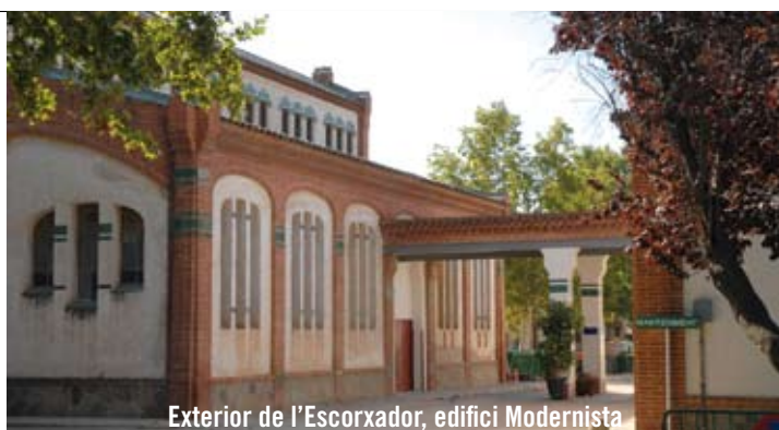
Exterior de l'Escorxador, edifici Modernista