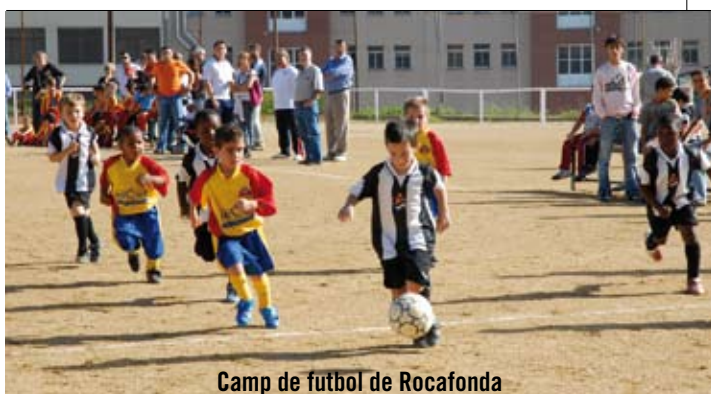
Camp de futbol de Rocafonda