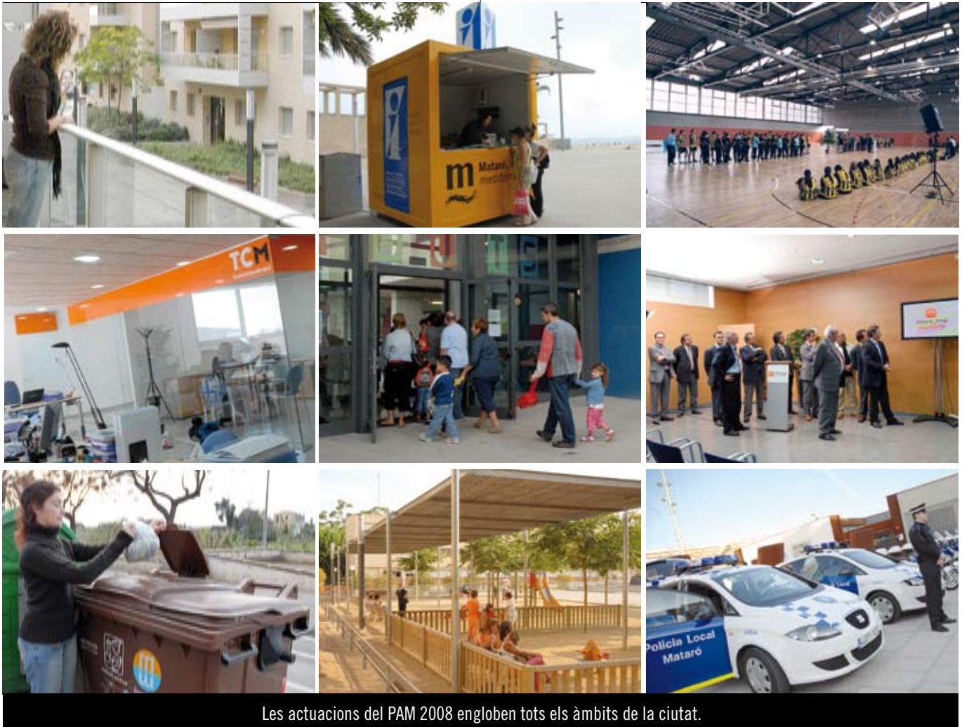
Les actuacions del PAM 2008 engloben tots els àmbits de la ciutat.