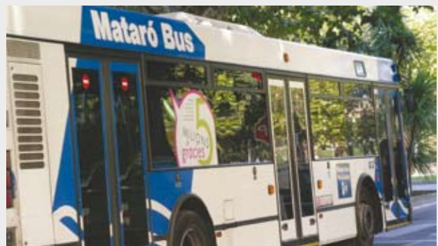
El Mataró Bus ampliarà la seva flota i línies gràcies a l'increment de la subvenció que han pactat els governs català i espanyol.