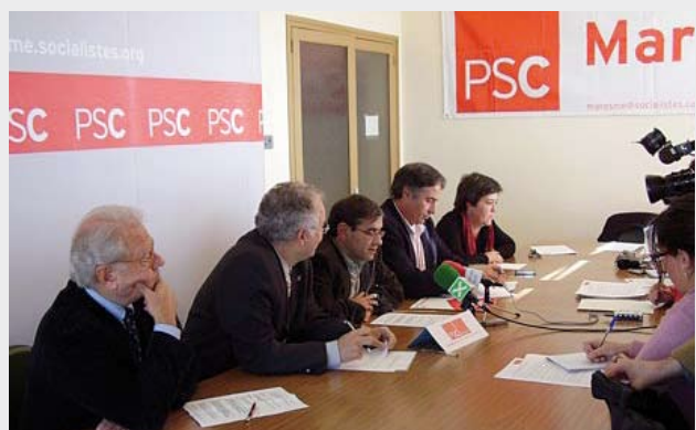
Els socialistes del Maresme presentant la seva proposta sobre la N-II.