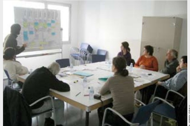
Taller participatiu realitzat a Mataró sobre el catàleg del paisatge.

Pas a pas, amb prudència i estudiant altres exemples de pràctiques Mataró ha desenvolupat un model que avança en la direcció correcte que emmarca i propicia la participació i sobre el que cal continuar treballant.