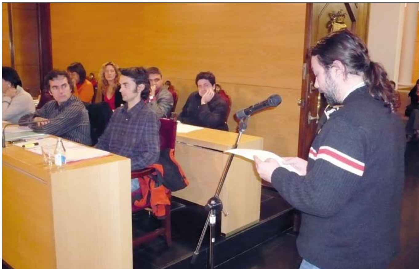
En el Ple de desembre hi van haver dues intervencions veïnals, una de Cirera i l'altra de Cerdanyola (a la foto).