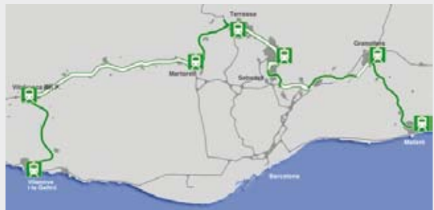
Una nova línia enllaçarà Mataró amb Vilanova i la resta de ciutats de la corona de Barcelona.