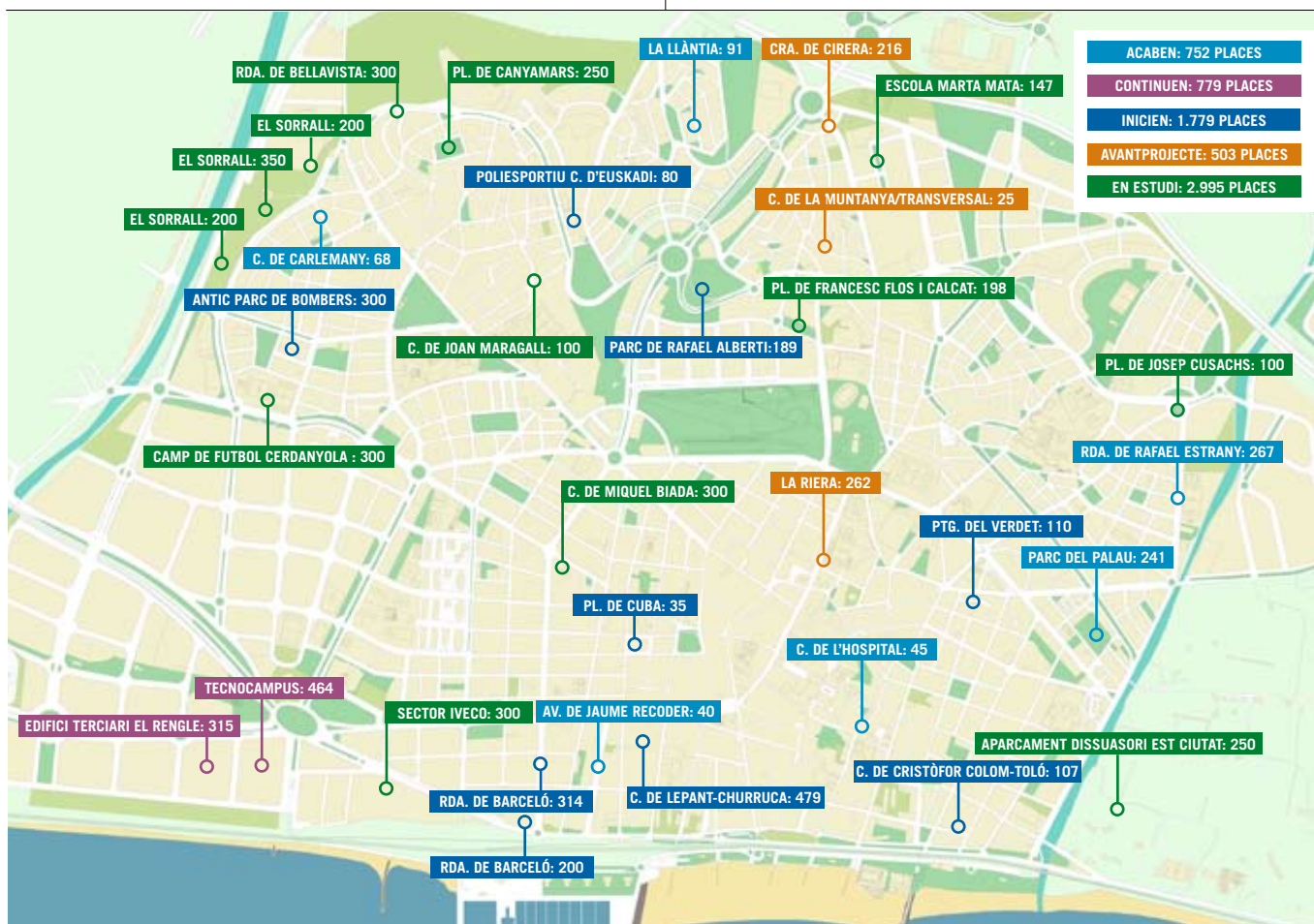
Plànol de situació dels aparcaments en els seus diferents estadis de treball.