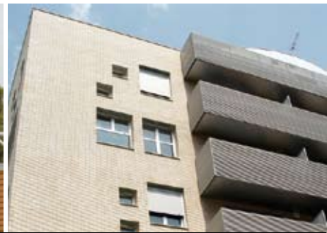
Prohabitatge s'encarrega de tramitar les subvencions existents per accedir a un habitatge i per rehabilitar o actualitzar un edifici.