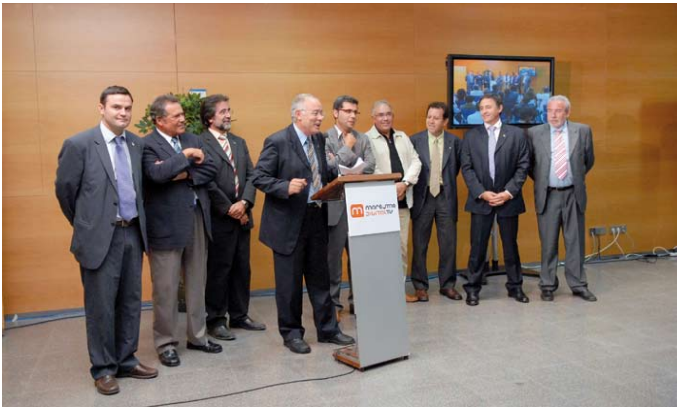
Alcaldes i regidors d'alguns dels municipis que gestionen el canal de TV digital pública del Baix Maresme.

El canal públic de Televisió Digital Terrestre, que gestiona el Consorci Digital Mataró-Maresme, aposta per una graella variada amb una clara vocació de servei públic i innovació tecnològica.