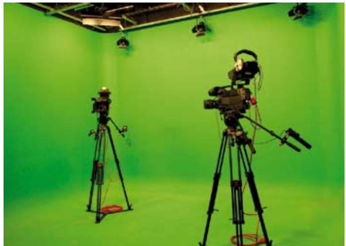
La taula de control, l'equip de redactors, el centre tècnic i una imatge del plató virtual.