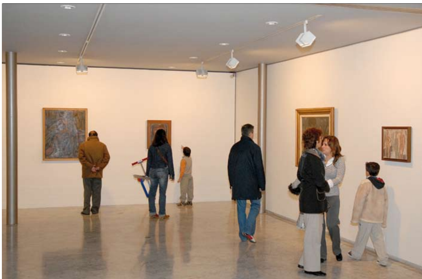
La mostra recull 72 peces de Torres-García que es poden veure al Museu de Mataró i a Can Palauet (a la foto).

La mostra, que es va inaugurar el 19 de gener i es podrà veure fins al 17 de febrer, està instal·lada al Museu de Mataró i a Can Palauet. Joaquín Torres-García és un dels artistes més destacats de la primera meitat del segle XX.