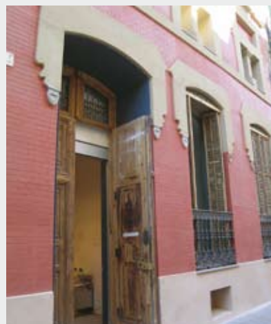
Ca l'Arenas. Centre d'art del Museu de Mataró