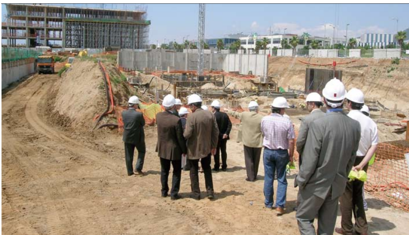
L'edifici del TecnoCampusMataró s'està construint al sector del Rengle (a la foto un moment de la visita d'obres que es va fer el juny).

Els tres partits d'esquerres que formen el Govern: PSC, ICV-EUiA i ERC van signar fa un any un Acord de Govern on s'estableixen les prioritats dels 4 anys de mandat. El document posa èmfasi en l'educació, l'habitatge, la seguretat, l'urbanisme, el desenvolupament econòmic, la cohesió i la integració. Un any després, s'han aconseguit moltes de les actuacions projectades.