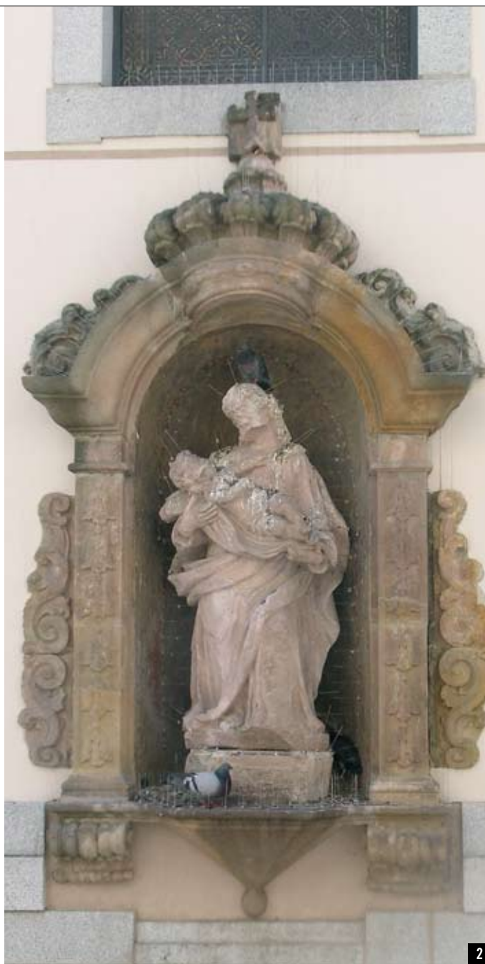
1. La població de coloms també perjudica l'estat del patrimoni (Església de Sant Josep)

Les colònies incontrolades de gats i els coloms són els grups animals periurbans més abundants. Els gats salvatges acostumen a ser alimentats per alguns ciutadans i per aquest motiu són uns dels animals més estesos. Per la seva part, els coloms tenen una intensa relació amb les poblacions humanes i el creixement incontrolat de la seva població pot provocar la transmissió de malalties, sorolls, accidents en la via pública o el deteriorament d'edificis i monuments, entre d'altres.