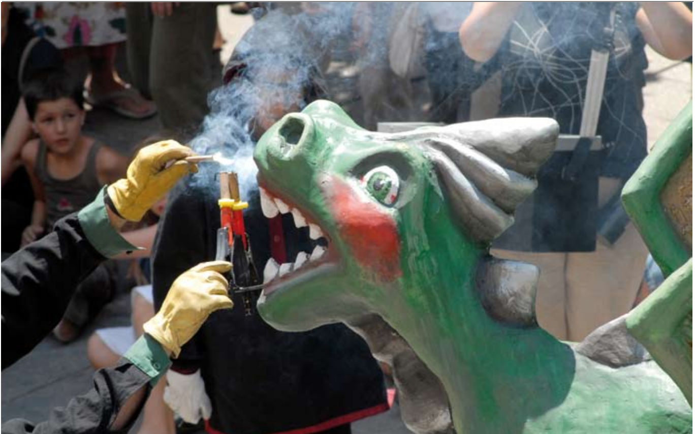
El Dragalió ballarà enguany amb el seu homòleg de Granollers en el Ball dels dracs.

Entre les novetats d'enguany hi ha la sonorització del Desvetllament bellugós i un conjunt d'activitats que s'engloben sota el nom de "Festa, fires i firaires". Aquesta proposta de quatre dies es farà al Parc Central i gira al voltant del circ.