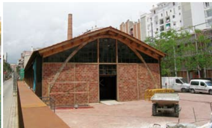
L'educació, la prevenció, l'esport i els joves (a la foto Nau Gaudí on s'instal·larà el Telecentre) són punts fonamentals de l'Acord de Govern.