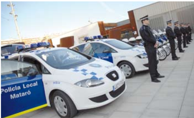
La cultura i la seguretat també són prioritats del Govern.

dació Privada Carmen i Lluís Bassat perquè Mataró disposi d'un nou espai museístic. Aquest espai s'afegirà al Museu de la Ciutat que s'ubicarà a Can Marfà.