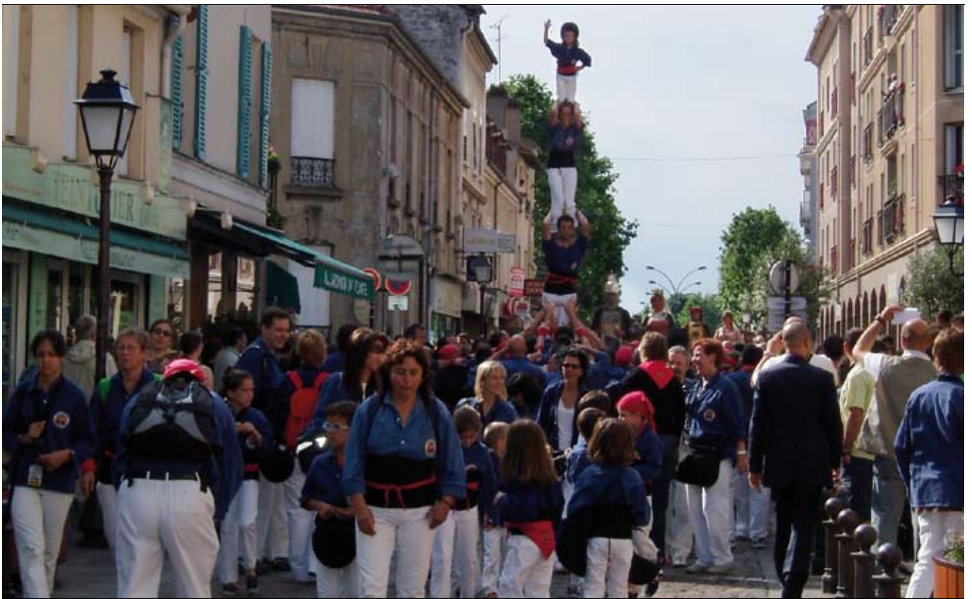
La Colla Castellerà Capgrossos de Mataró en un moment de la seva actuació a terres franceses.

Els Gegants, el Drac, la Momerota, les Diablasses, l'Àliga i la Colla Castellerà Capgrossos van ser les figures i les colles de Mataró presents en la festa major de la ciutat agermanada de Créteil: la Jour de fête. Els van acompanyar més de 360 mataronins i la delegació oficial. A la desfilada hi van participar uns 3.000 ciutadans de Créteil i va ser seguida per unes 10.000 persones.