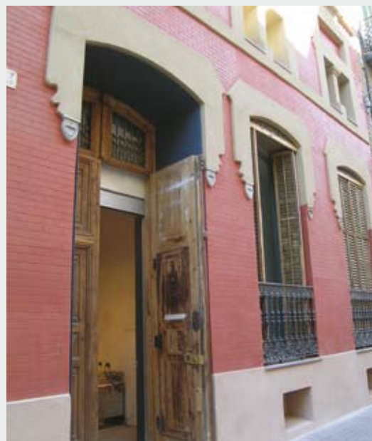
Ca l'Arenas. Centre d'art del Museu de Mataró