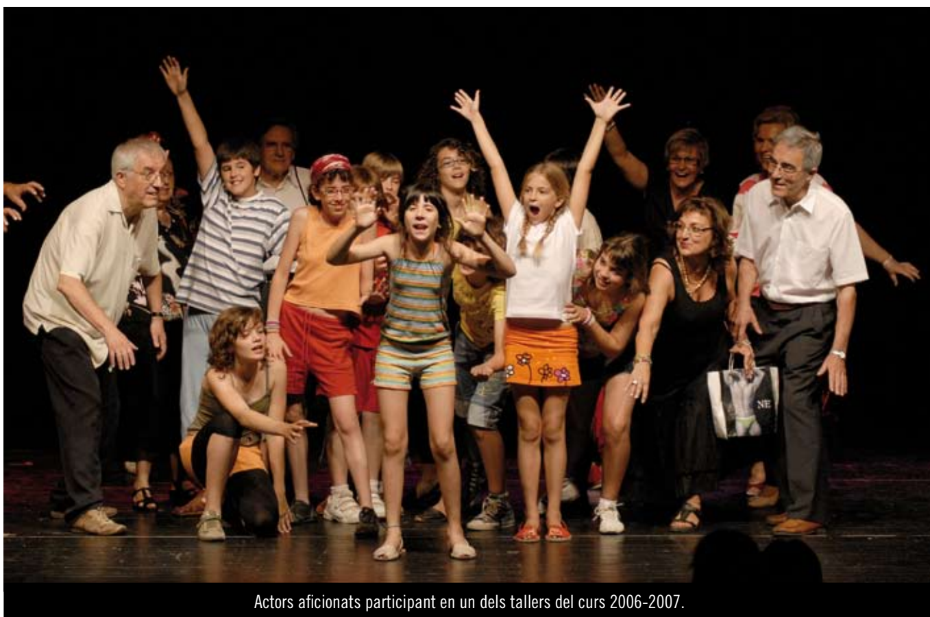
Actors aficionats participant en un dels tallers del curs 2006-2007.

Entre el 7 i el 24 s'oferiran cursos d'accés lliure, adreçats tant a majors com a menors d'edat. Inclouen iniciació al teatre, clown, teatre en moviment, equilibri amb objectes, dansa i acrobàcia expressiva.