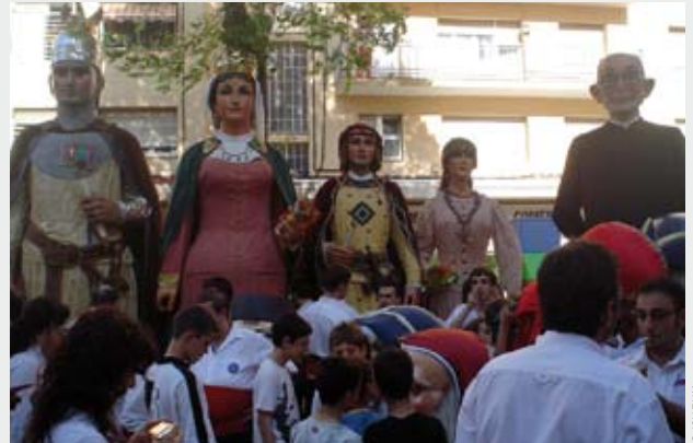
Els gegants de Mataró i Mm. Biscuter en la Festa Major de Cerdanyola 2008.

En el Ple municipal de maig vam acordar per unanimitat donar suport a la inscripció dels castells a la llista representativa del patrimoni cultural i immaterial de la humanitat. Un reconeixement