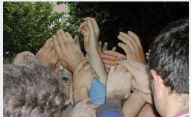
Inici de la construcció d’un castell en l’aniversari del primer any de l’invasió d’Irak.

ment que el dona la UNESCO. Ens va plaure especialment donar suport a aquesta proposta pel que han estat els castells, pel que són i pel que estan cridats a ser. Des del segle XVIII han estat una manifestació festiva i col·lectiva de la cultura catalana. Són una mostra de la riquesa cultural i social del país com activitat oberta i integradora d’edats, gènere i condició social. Són exemple dels valors necessaris per a la cohesió social com és la cooperació, l’ajuda mútua i la solidaritat. A Mataró tenim per testimoni a la Colla Casteller Capgrossos, a la qual volem felicitar per la seva trajectòria en coherència amb els valors que vol preservar el Patrimoni Immaterial; la diversitat cultural i la creativitat humana.