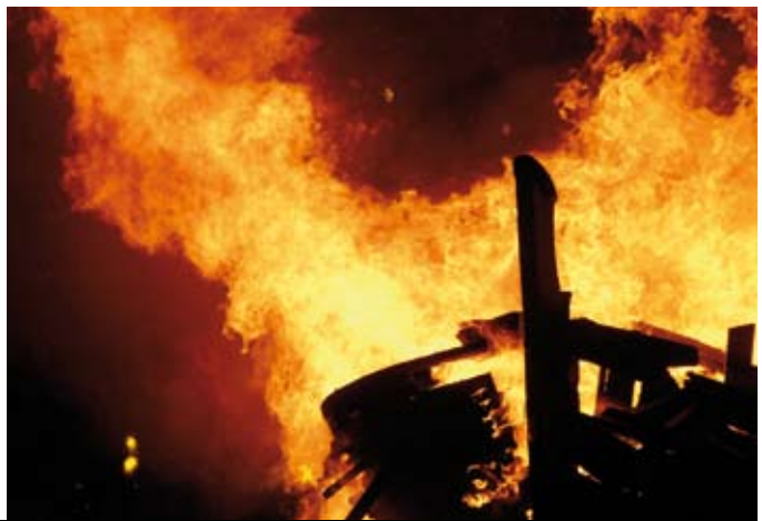
El Festival Shakespeare (a la foto Can Ribot), Les Santes i el Festival Cruïlla de Cultures ompliran de festa i música l'estiu.