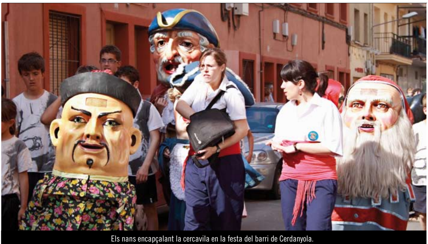
Els nans encapçalant la cercavila en la festa del barri de Cerdanyola.

El calendari de festes dels barris i carrers va des del maig fins a l'octubre. Balls, sopars, gimcanes, esports, xocolatades, concerts, sardinades, correfocs, gegants i capgrossos, activitats organitzades per veïns i pensades per a tots.