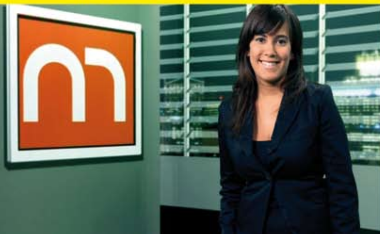
Mira L'ENTREVISTA . Cada setmana un entrevistador diferent ens presenta un personatge de la comarca. Els dimecres a les 22h, amb repetició a les 00.30h, els dijous a les 9h, a les 13h i a les 17h i els diumenges a les 13.30h