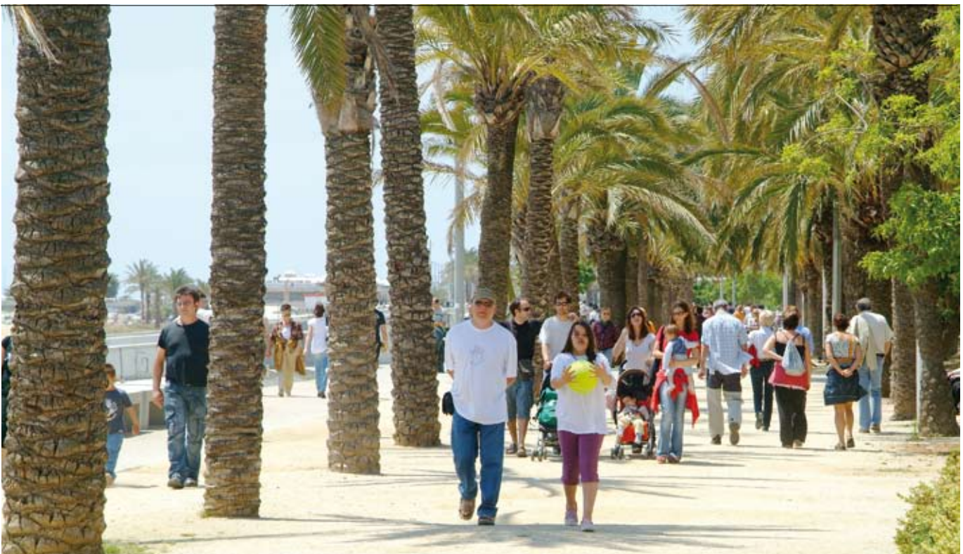
El passeig Marítim és un dels espais que acollirà més propostes lúdiques durant l'estiu.

La ciutat concentra durant la temporada estiuenca moltes activitats i ofertes turístiques tant lúdiques com culturals. Com a novetat, els usuaris tindran un espai de lectura al punt d'informació turística de la platja.