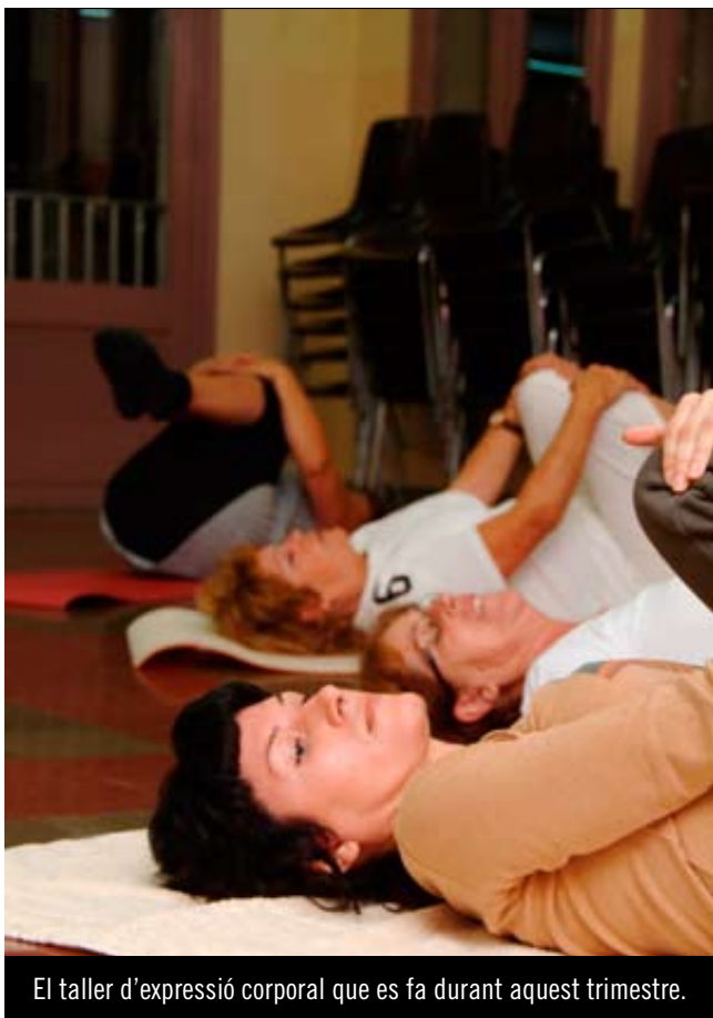
El taller d'expressió corporal que es fa durant aquest trimestre.