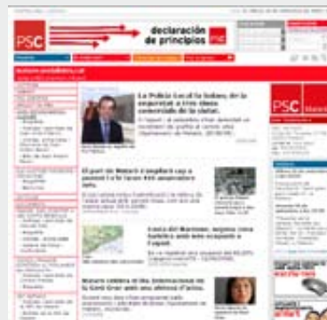
L'activitat dels regidors socialistes es publica diàriament a http://mataro.socialistes.cat .