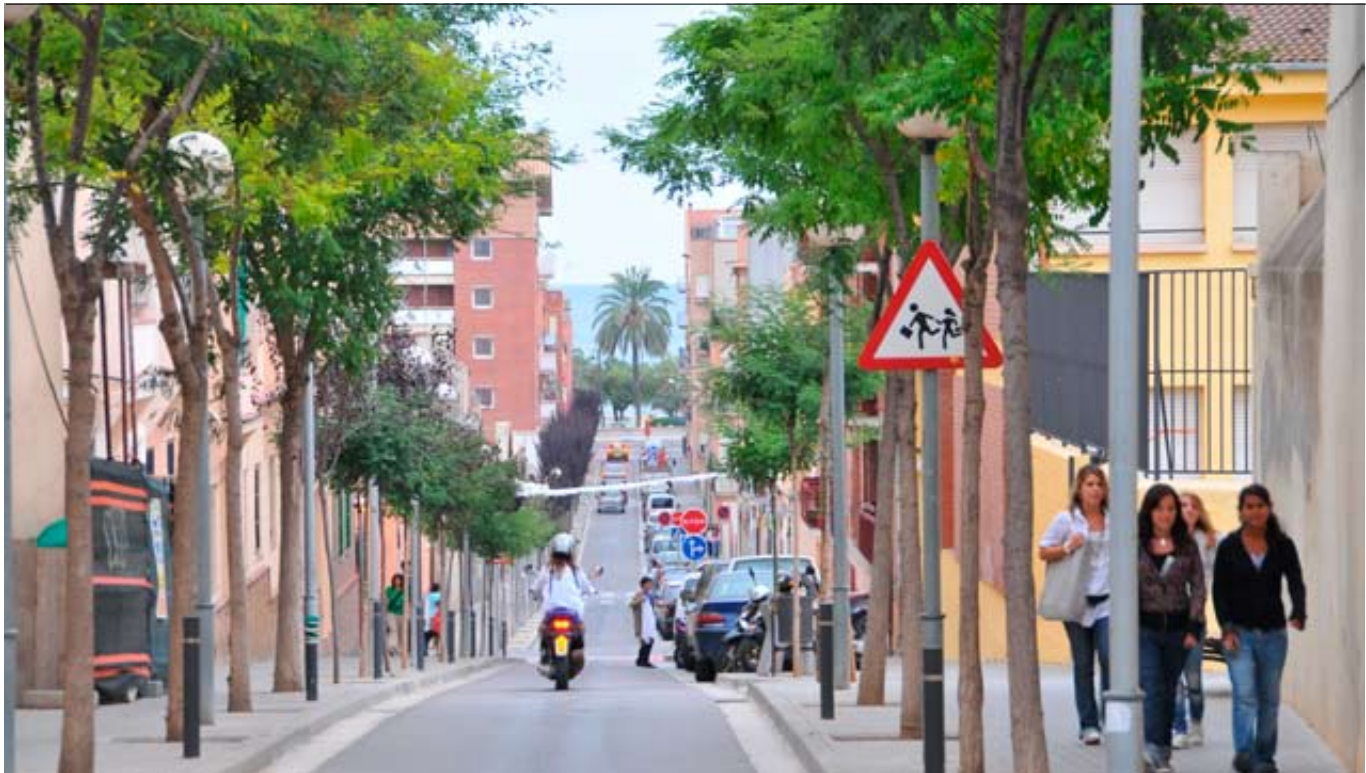
El carrer de Pascual Madoz després de la reurbanització, amb voreres més àmplies i accessibles.

Mataró es renova i fa carrers més accessibles. La prolongació del carrer de Pedro Antonio de Alarcón i la reurbanització dels carrers de Sant Pelegrí, Pascual Madoz i Mitja Galta són les darreres obres finalitzades.