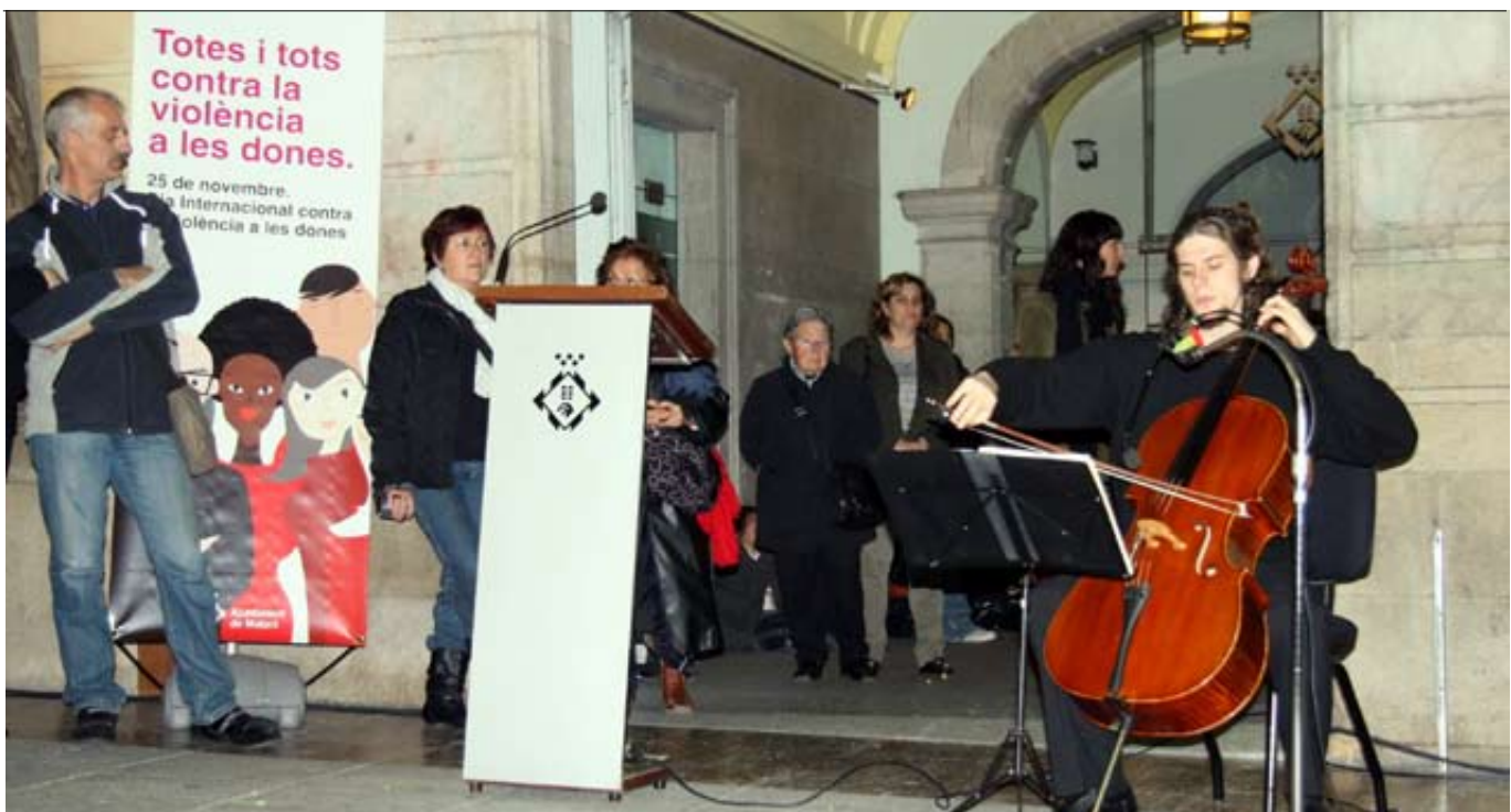
Una imatge de la celebració del Dia Internacional contra la Violència a les dones de l'any passat.

En aquesta línia, s'ha organitzat la primera Jornada sobre Violència Masclista per abordar aquesta problemàtica i el Centre d'Informació i Recursos per a les Dones ofereix, des de fa un any i mig, assessorament, informació i orientació.