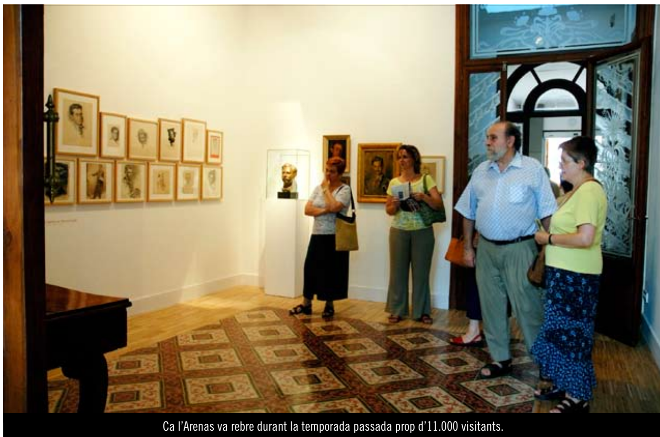
Ca l'Arenas va rebre durant la temporada passada prop d'11.000 visitants.