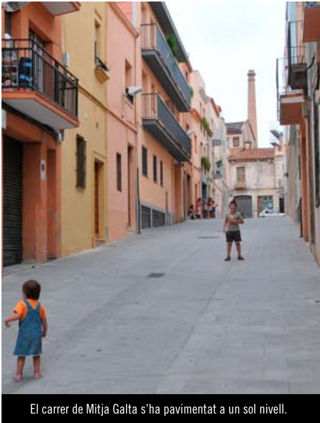
El carrer de Mitja Galta s'ha pavimentat a un sol nivell.