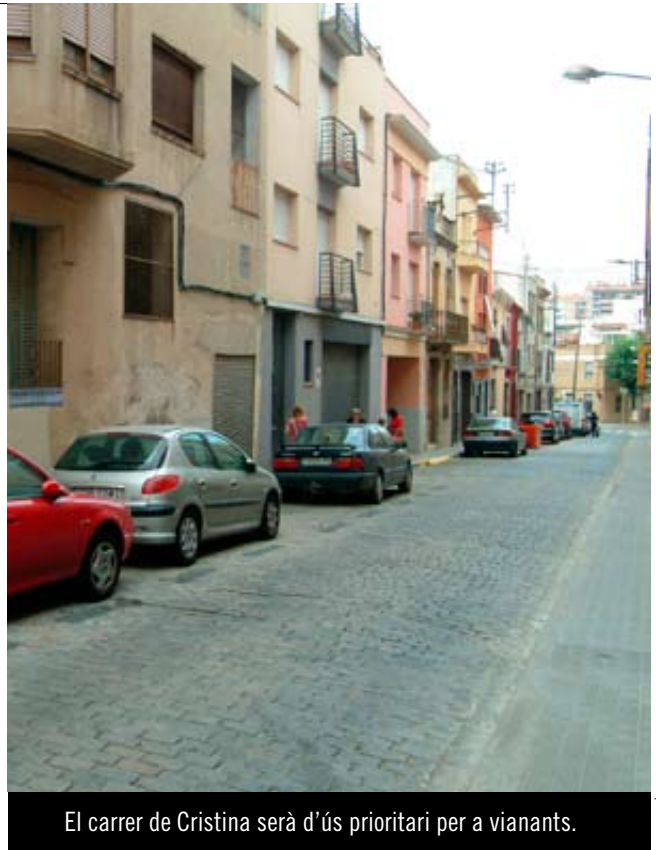
El carrer de Cristina serà d'ús prioritari per a vianants.

ple, de les obres de reurbanització del carrer de Massevè que començaran a principis d'octubre. El vial es pavimentarà a un sol nivell i es col·locaran a terra lletres de planxa de fosa dúctil formant el nom del carrer, seguint la mateixa estètica d'altres carrers del Centre. Les obres duraran 18 setmanes, i s'han adjudicat a l'empresa Vialitat i Serveis, SL per un import de 133.717 euros.