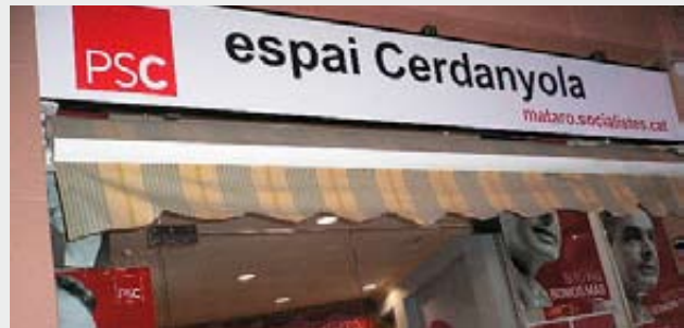
L'Espai Cerdanyola és la seu social dels socialistes en aquest barri.

Sovint fem també actes amb regidors o amb l'alcalde,