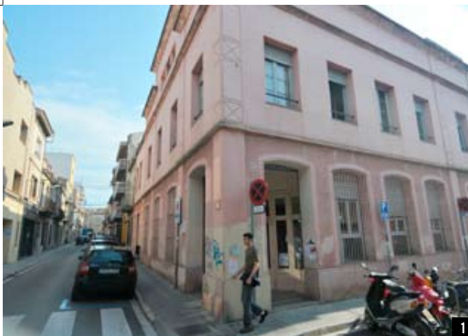
1 © CAPRIS

L'11 de setembre MaresmeDigital TV va celebrar un any de vida. El nou mitjà de comunicació públic ha consolidat la programació regular i ha arribat a un acord amb el Consorci Teledigital Maresme Nord per treballar conjuntament a la comarca i disposar de dos canals públics de TDT. Durant el primer any de funcionament, MaresmeDigital TV ha realitzat 8.664 hores d'emissió: un 20,81% de producció pròpia, el 69,14% amb col·laboració amb la Xarxa de Televisions Locals de Catalunya (XTVL) i el 9,90% eren repeticions de programes propis.