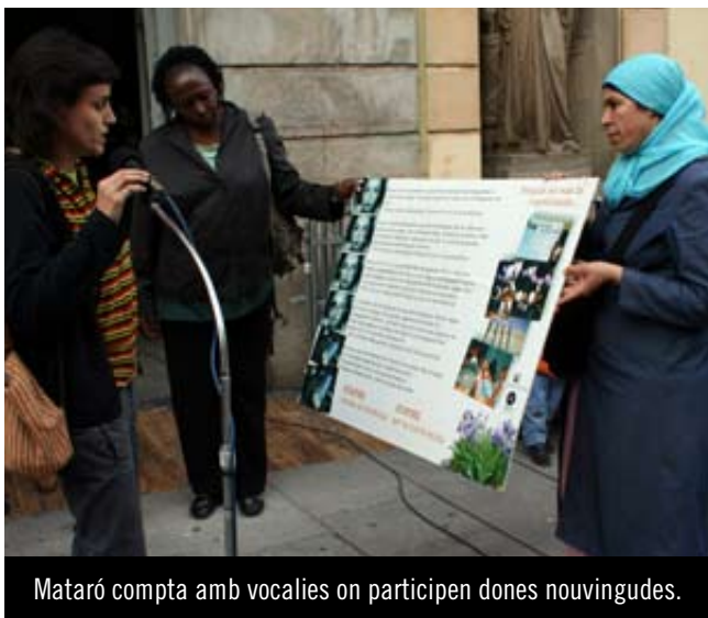
Mataró compta amb vocalies on participen dones novingudes.

El Dia Internacional contra la Violència de Gènere se celebra el 25 de novembre. A Mataró, com en altres municipis de Catalunya, es llegirà un manifest on cada any es posa l'accent en la necessitat de construir una societat basada en la igualtat d'oportunitats, la convivència pacífica i el respecte a totes les persones. A banda de la lectura d'aquest manifest institucional, hi haurà un seguit d'activitats organitzades per entitats de la ciutat.