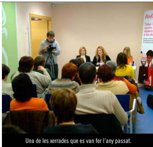
Una de les xerrades que es van fer l'any passat.

La segona jornada comptarà s'abordarà la prevenció de la violència a través de la coeducació. A continuació es por-