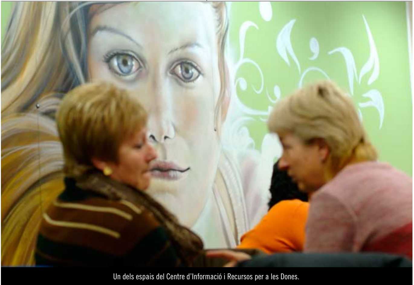
Un dels espais del Centre d'Informació i Recursos per a les Dones.