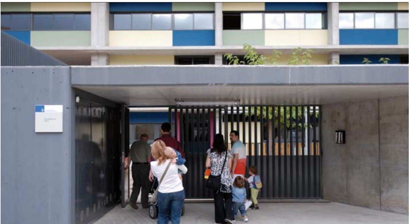
El primer dia del curs escolar els accessos a les escoles s'omplen de pares i mares que acompanyen als seus fills.

Les escoles bressol, els centres d'educació infantil, primària i secundària obren les portes durant el setembre. Enguany 865 infants aniran a les escoles bressol municipals i 20.425 als diferents cicles de l'educació obligatòria. L'oferta de Formació Professional s'amplia i les dues universitats iniciaran el primer curs integrades en la Fundació TecnoCampusMataró.