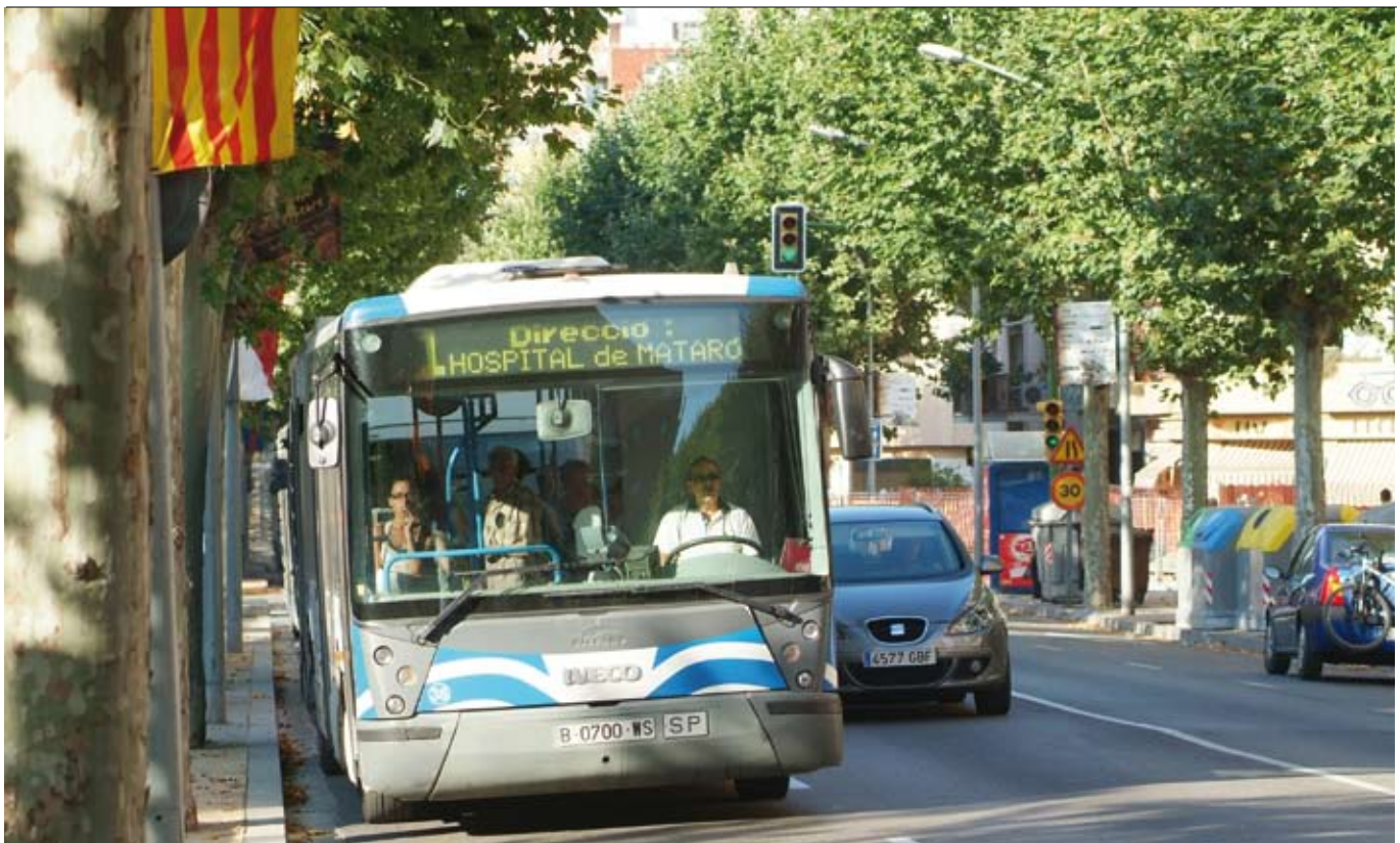
El servei del Mataró Bus millorarà a partir del 2009 amb més cobertura i més freqüència de pas.

Del 22 al 29 de setembre se celebra la Setmana de la Mobilitat Sostenible i Segura, una oportunitat perquè el ciutadà conegui millor les opcions per traslladar-se per la ciutat. Una de les alternatives al vehicle privat és el Mataró Bus, que a partir de l'1 de gener de 2009 ampliarà la cobertura.