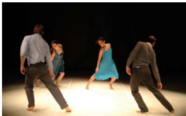
Imatges promocionals de quatre dels sis espectacles programats.