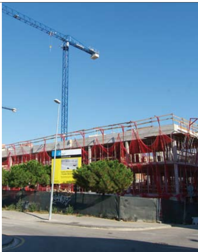
D'esquerra a dreta, el centre educatiu de Figuera Major que comptarà amb un CEIP i una escola bressol i el futur CEIP Montserrat Solà.