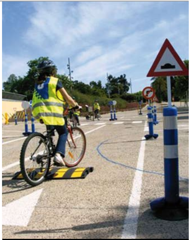
Una de les classes d'educació viària.

a les 23.16 h a la segona fase. A banda d'aquesta ampliació, l'empresa ofereix un servei nocturn complet que es farà durant dos mesos en fase de prova per valorar la demanda real. CTSA ampliarà el nombre d'autobusos en servei. La xifra actual durant el dies feiners és de 22 que passaran a ser 25, en una primer fase, i a 30 en la segona. Actualment, els dissabtes hi ha 15 autobusos que passaran a ser 19 vehicles en la nova etapa. Per últim, els dies festius que ara compten amb 10 vehicles, passaran a ser 11 i 14. Altres millores que ha presentat l'empresa CTSA és la creació d'una nova web, quatre nous plafons d'informació dinàmica a les parades per saber el temps d'espera fins a l'arribada de l'autobús i l'elaboració d'un estudi per conèixer amb més exactitud les necessitats dels usuaris. També es crearà un sistema per donar informació als usuaris que ho sol·licitin via sms, s'aplicarà una nova eina de gestió de la flota per fer un seguiment minut a minut de la prestació del servei i s'incorporaran, en dues fases, 12 nous autobusos, alguns dels quals seran per substituir els vehicles més antics i per a noves incorporacions. El nou contracte tindrà vigència des del 2009 fins al 2013.