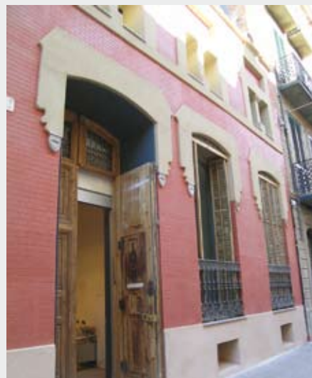
Ca l'Arenas. Centre d'art del Museu de Mataró