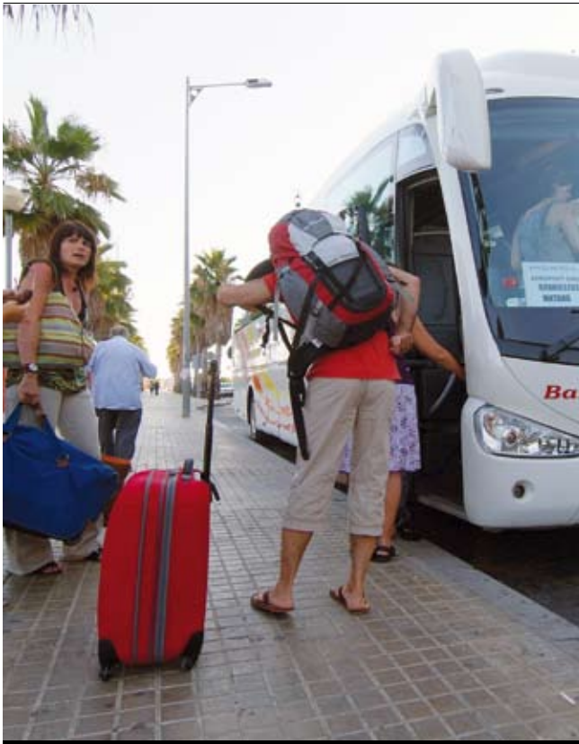
Usuaris de la línia que uneix Mataró amb l'aeroport de Girona.