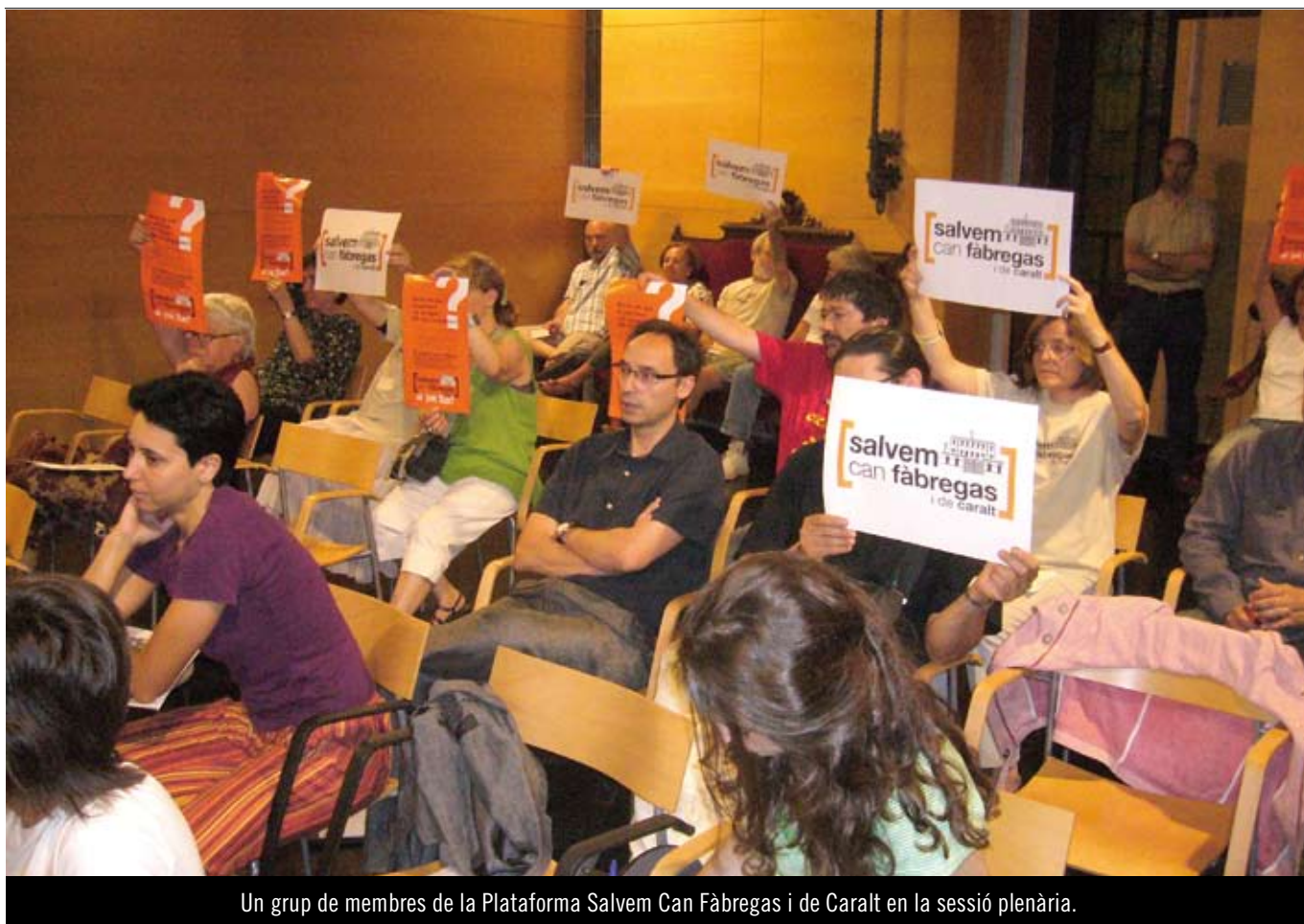
Un grup de membres de la Plataforma Salvem Can Fàbregas i de Caralt en la sessió plenària.