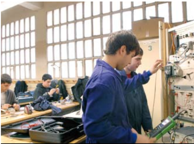
La teoria es combina amb la pràctica als cicles formatius.