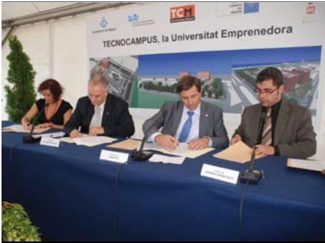
Les dues escoles universitàries s'integren en el TCM.