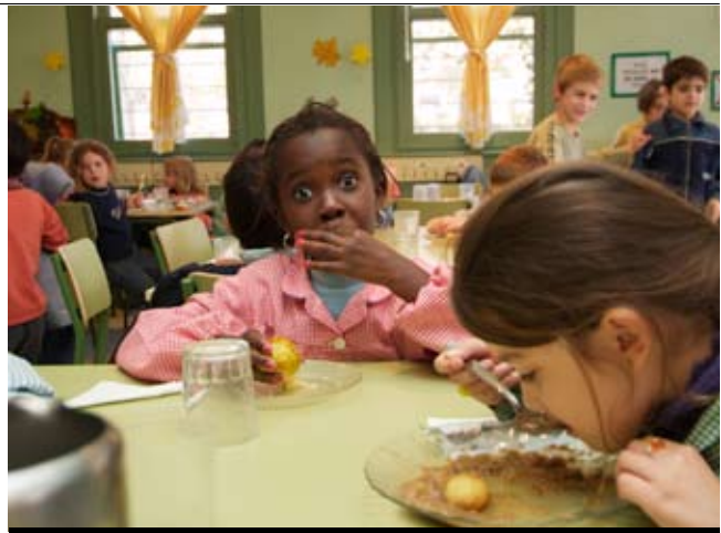
Un dels serveis complementaris és el de menjador.