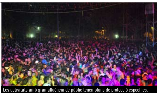
Les activitats amb gran afluència de públic tenen plans de protecció específics.