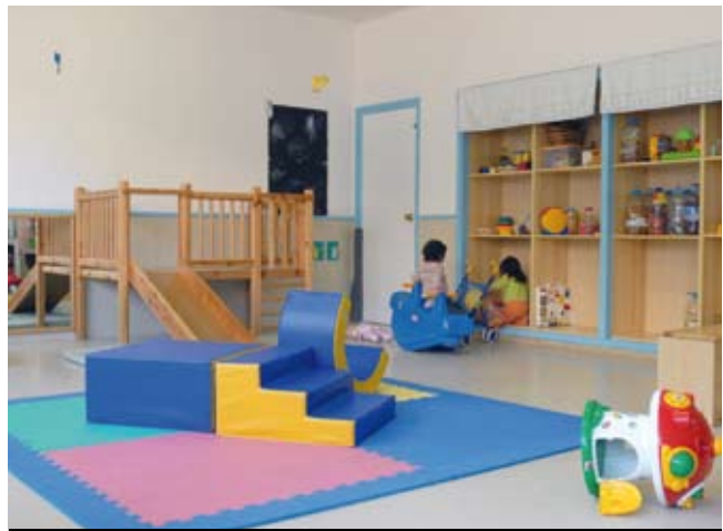
L'espai per al joc és un element comú de les escoles bressol.