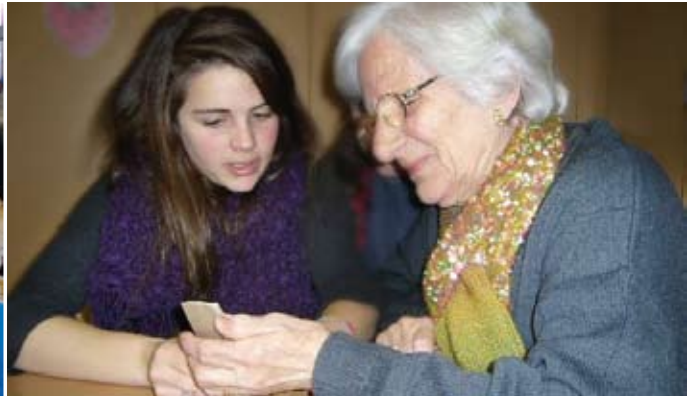
Un grup d'avis fent tai-txi, el festival de Nadal de les activitats esportives i un taller intergeneracional.