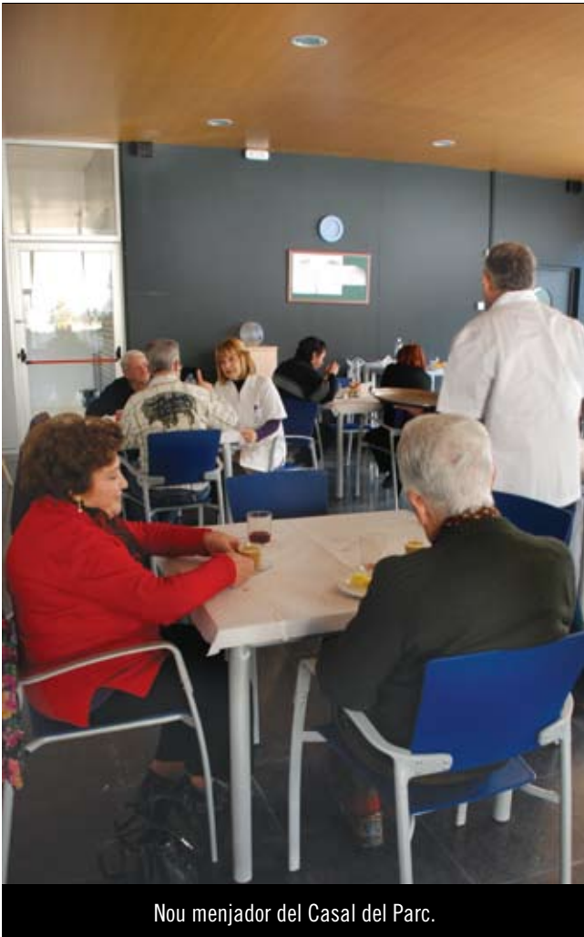
Nou menjador del Casal del Parc.

diürns de promoció del benestar de la vellesa mitjançant el foment de la convivència i les relacions personals. Ofereixen una programació de tallers formatius, sortides culturals i balls setmanals. També disposen de servei de bar, i en el cas de Cerdanyola, Rocafonda i del Parc, també ofereixen, de dilluns a divendres, servei de menjador amb un menú equilibrat nutricionalment a un preu assequible (4,37 €). Precisament, el Casal Municipal de la Gent Gran del Parc va estrenar el nou menjador el passat mes de setembre. La finalització de les obres, amb un pressupost d'adjudicació de 297.098 €, ha suposat la creació d'un menjador amb capacitat per a 30 comensals. Una altra de les noves instal·lacions que tindrà Mataró per a la gent gran és el segon casal de Cerdanyola, ara en obres. Aquest nou equipament, que se situarà a la cruïlla entre els carrers del Pla de Bages, del Penedès i de la Garrotxa, és una de les actuacions previstes al Projecte d'Intervenció Integral de Cerdanyola, finançades per la Llei de Barris de la Generalitat de Catalunya.