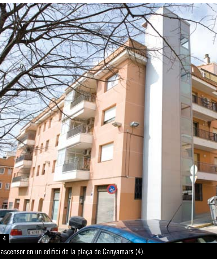
4 ascensor en un edifici de la plaça de Canyamars (4).