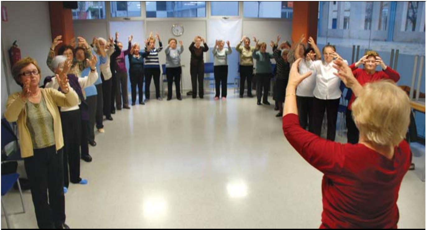
Una de les activitats que es porten a terme al Casal Santes-Escorxador, la tardor passada.

El Casal Municipal de la Gent Gran Santes-Escorxador, inaugurat a l'estiu, se suma a la xarxa d'equipaments municipals per a la gent gran. Mataró disposa de nou casals municipals que ofereixen més de 40 activitats diferents.