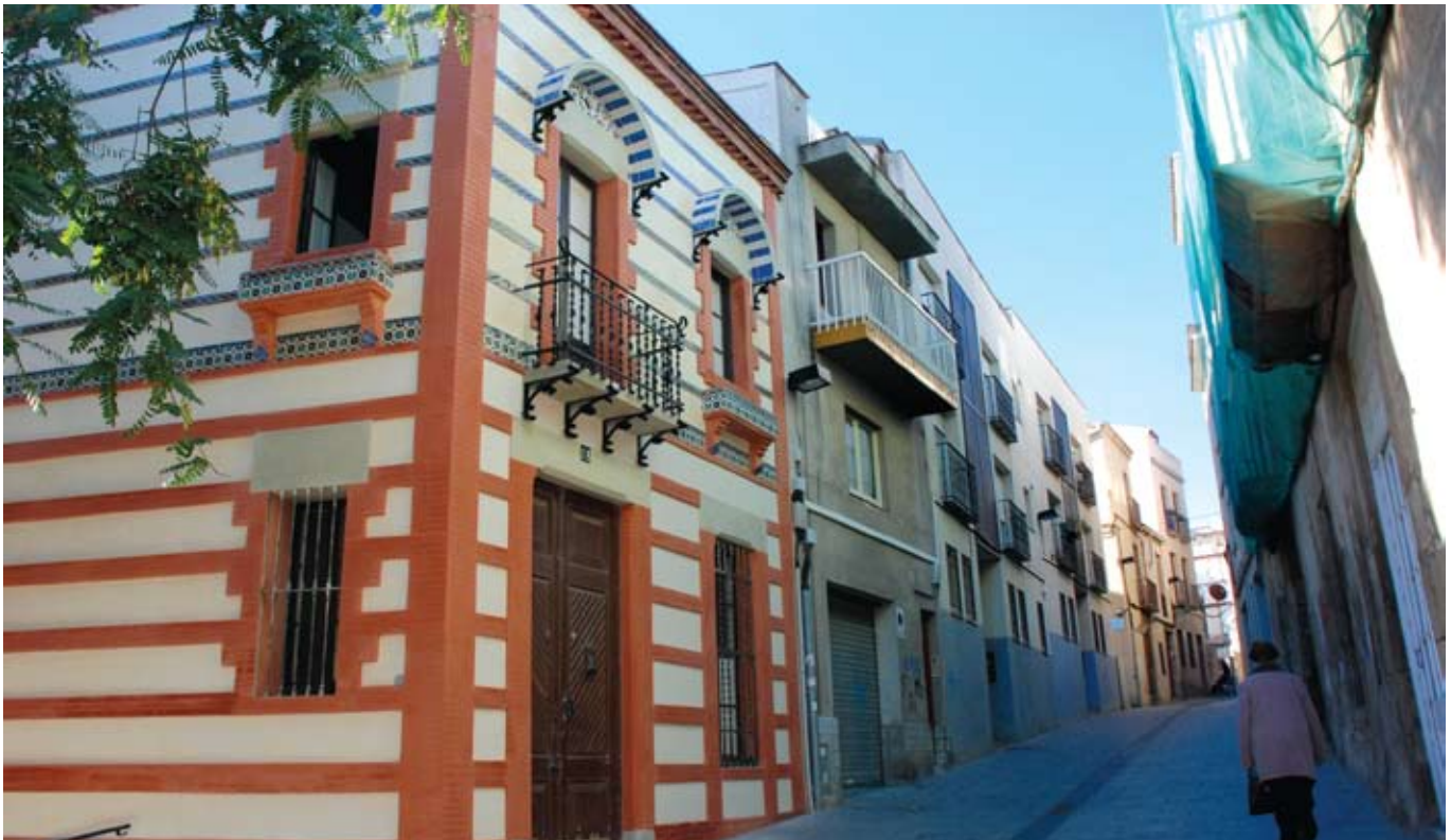
Can Sisternes, antic casal barroc del s.XVIII situat al carrer de Sant Simó, s'ha rehabilitat preservant els elements catalogats.

L'impuls de la millora dels edificis residencials és un dels principals reptes del Govern municipal que treballa per aconseguir una ciutat amb habitatges i equipaments municipals rehabilitats i adaptats a les noves necessitats.