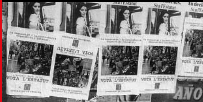
Estàvem en ple procés de transició cap a la democràcia