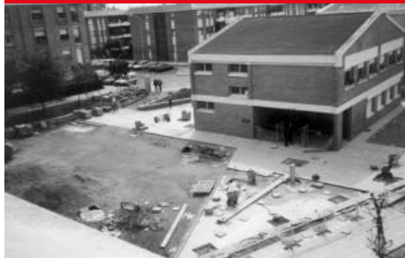
1997 Obres per arreglar el pati de l'escola.