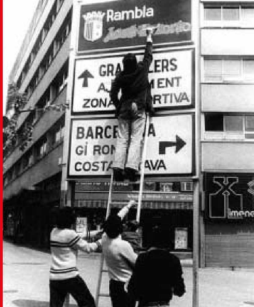
El català: a la recerca de la normalitat

Pel que fa a l'escola Els Tarongers, l'any 1988 marca la fi d'una desena d'anys de certa indefinició institucional en què l'educació d'adults va ser una mena d'obligació molesta per al Departament d'Ensenyament. Pel maig va sortir publicada al DOGC la creació oficial de l'escola i a l'estiu totes les competències en educació d'adults passaren al Departament de Benestar Social.