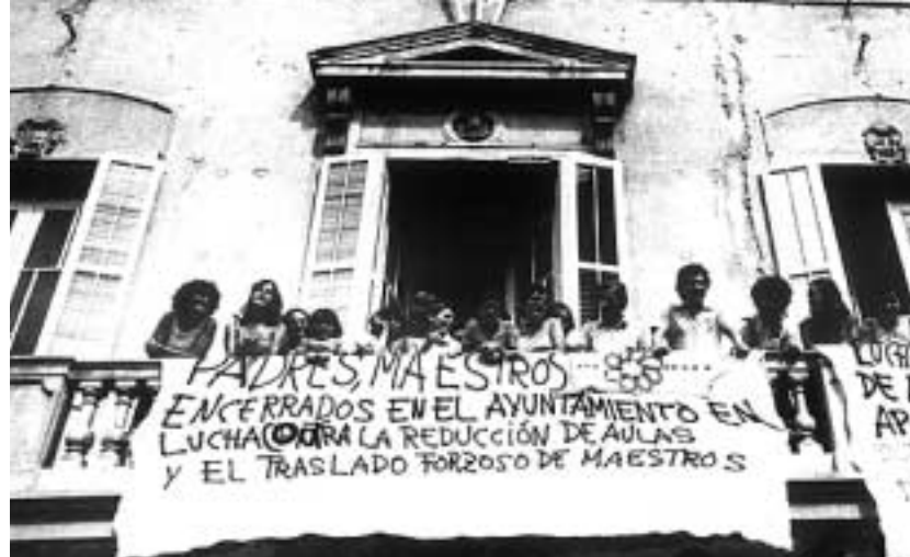
Eren temps de reivindicacions en demanda de canvis i millores

Aquest quart de segle passarà a la història educativa com el període de la irrupció dels ordinadors a l'escola. Avui dia, un nen o una nena de quatre anys es familiaritza amb l'ordinador al mateix temps que amb el llapis. A casa, a l'escola i allà on vagi, el teclat i la pantalla hi són presents. En el curs inicial de les escoles (1978), els mestres i els alumnes més grans, com a molt, utilitzaven la màquina d'escriure quan es tractava de cercar una presentació acurada dels treballs. A finals de 1984 es creà la Comissió d'Informàtica del Departament d'Ensenyament que engegà el Programa d'introducció dels recursos informàtics als centres. Algunes escoles, amb l'ajut de l'AMPA, s'avançaren i es dotaren d'un o dos ordinadors. Molt a poc a poc, amb finançaments provinents de diverses bandes, les màquines anirien arribant als centres i avui totes tenen l'aula d'informàtica. Després dels dubtes inicials sobre com casarien les noves tecnologies i l'escola, tothom es va adonar de la importància que començava a tenir l'ús de l'ordinador, tant a nivell personal com de cara a l'activitat docent. Si algú pensava que les noves tecnologies suplantarien la tasca