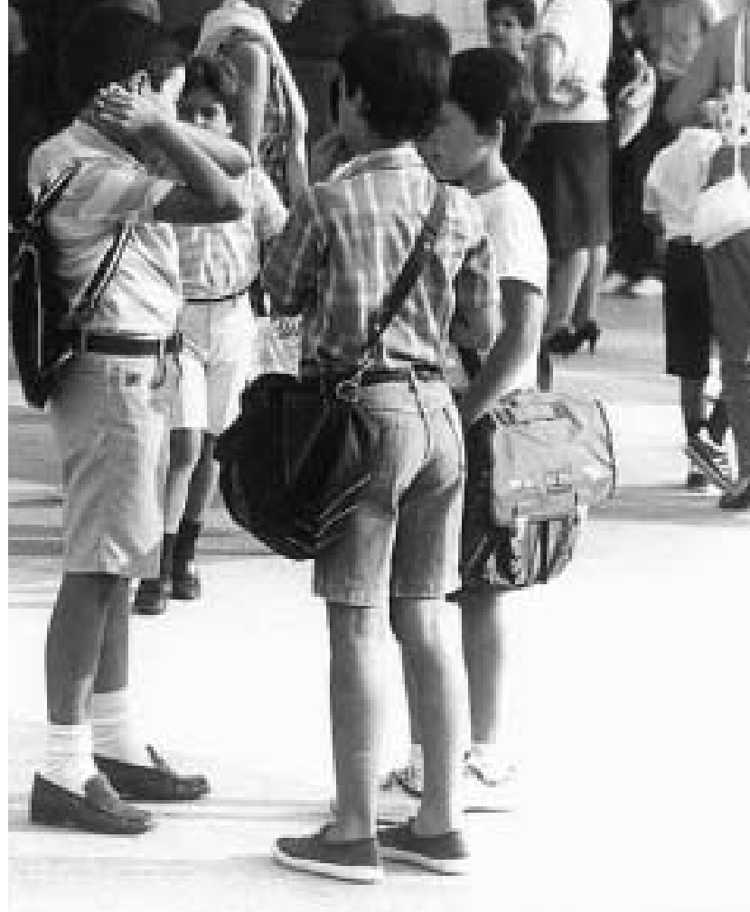
L'educació esdevé una peça cada cop més important de la societat

La LODE (1985) va regular la participació de mares i pares, els donava atribucions al Consell Escolar, els garantia el dret a associar-se, a utilitzar els espais escolars, a col·laborar en les activitats i a prendre part en la gestió dels centres. S'ha anat avançant en aquest marc ampli i obert, però amb dificultats. En general es detecta un dèficit participatiu del sector familiar