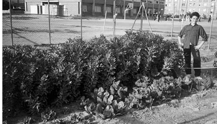
1987 Creació de l'hort escolar.

I és que, amb l'esforç i la dedicació de tota la Comunitat Educativa, hem anat reforçant l'estructura d'una torre que s'enlaira com un dia ho féu la de l'antiga casa pairal. Avui, que celebrem els 25 anys del seu naixement, podem estar ben contents de com ha anat evolucionant la nostra escola i podem mirar amb esperança i il·lusió cap al futur.