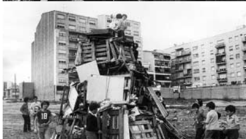
Mataró havia experimentat un creixement demogràfic espectacular