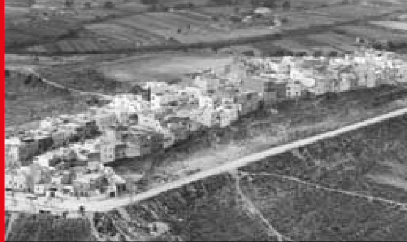
S'edificà en indrets al marge de tota previsió urbanística

Arribats a la segona meitat dels anys setanta, amb l'empenta de les esperances democràtiques i enmig d'una situació social agitatíssima, els barris perifèrics vivien situacions que podríem qualificar d'explosives: alta concentració humana i inexistents equipaments col·lectius. No és estrany que la lluita per l'escolarització dels fills sorgís com a prioritària: el dret a l'educació era un dret fonamental, la població en edat escolar havia crescut de manera desorbitada i, senzillament, no hi havia escoles. Existien col·legis estatals creats en els darrers decennis dels franquisme que aviat es manifestarien insuficients. En plena arrencada de la