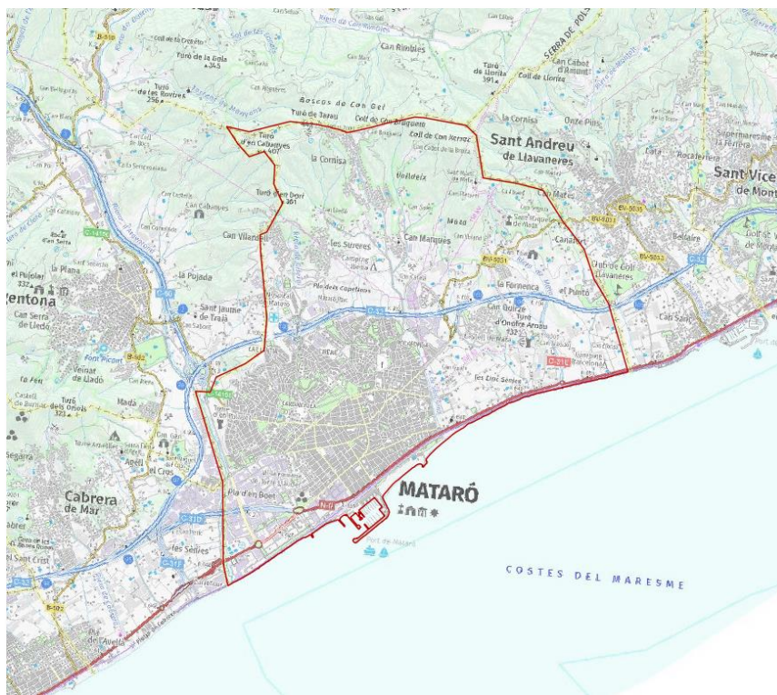
Figura 2: Límits de l'aglomeració de Mataró, mapa de localització